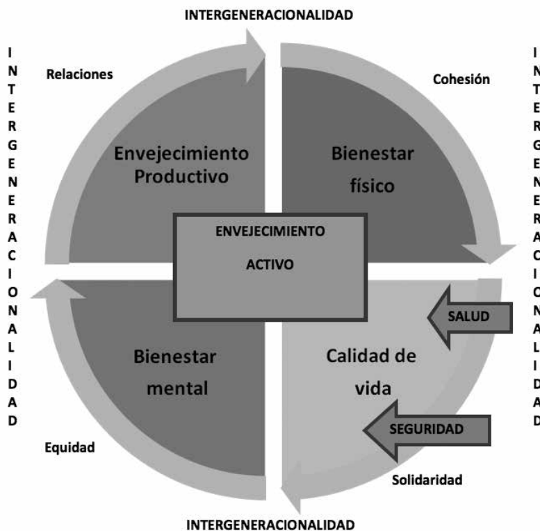
Gráfico 2. Envejecimiento activo

Elaboración propia a partir de los planteamientos de Thomae (1982).