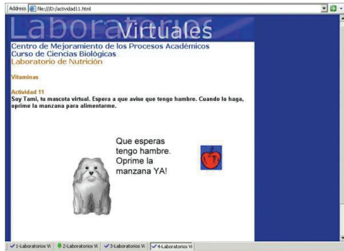
Fig. 3. Si a la mascota virtual, Tami, no se le alimentaba adecuadamente, sufría los síntomas de diversas enfermedades.