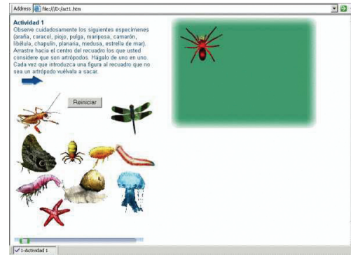
Fig. 6. Imágenes de invertebrados, que incluyen artrópodos y no artrópodos, y que deben seleccionarse interactivamente con base en las características aprendidas en la introducción teórica del laboratorio virtual.

Usa una tecnología muy novedosa, al permitir buscar insectos ocultos en el panorama de 360 grados del bosque.