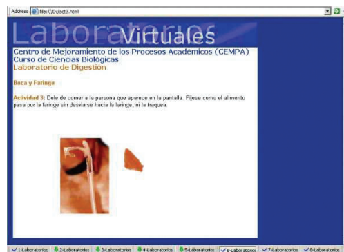
Fig. 5. Junto a esta imagen interactiva aparece el texto que explica cómo iniciar la animación.

Con un vídeo endoscópico se ilustra la estructura gástrica.