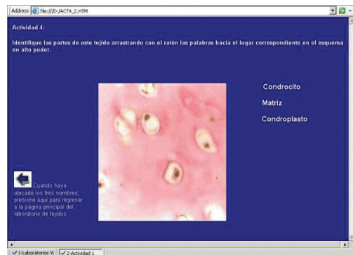
Fig. 2. Pantalla del laboratorio sobre tejidos del cuerpo humano.

El tema de los tejidos orgánicos se presenta mediante un cuerpo humano, una imagen de un microscopio y fotografías de tejidos vistos en dos niveles de amplificación. Con el ratón de la computadora se puede “desarmar” el cuerpo humano, arrastrando cada tejido hasta el microscopio para observarlo amplificado (Fig. 2).