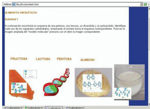
Fig. 4. Se facilitó el aprendizaje de la estructura química del almidón asociándola directamente con una imagen conocida: la de un alimento que lo contiene en grandes cantidades (la papa).