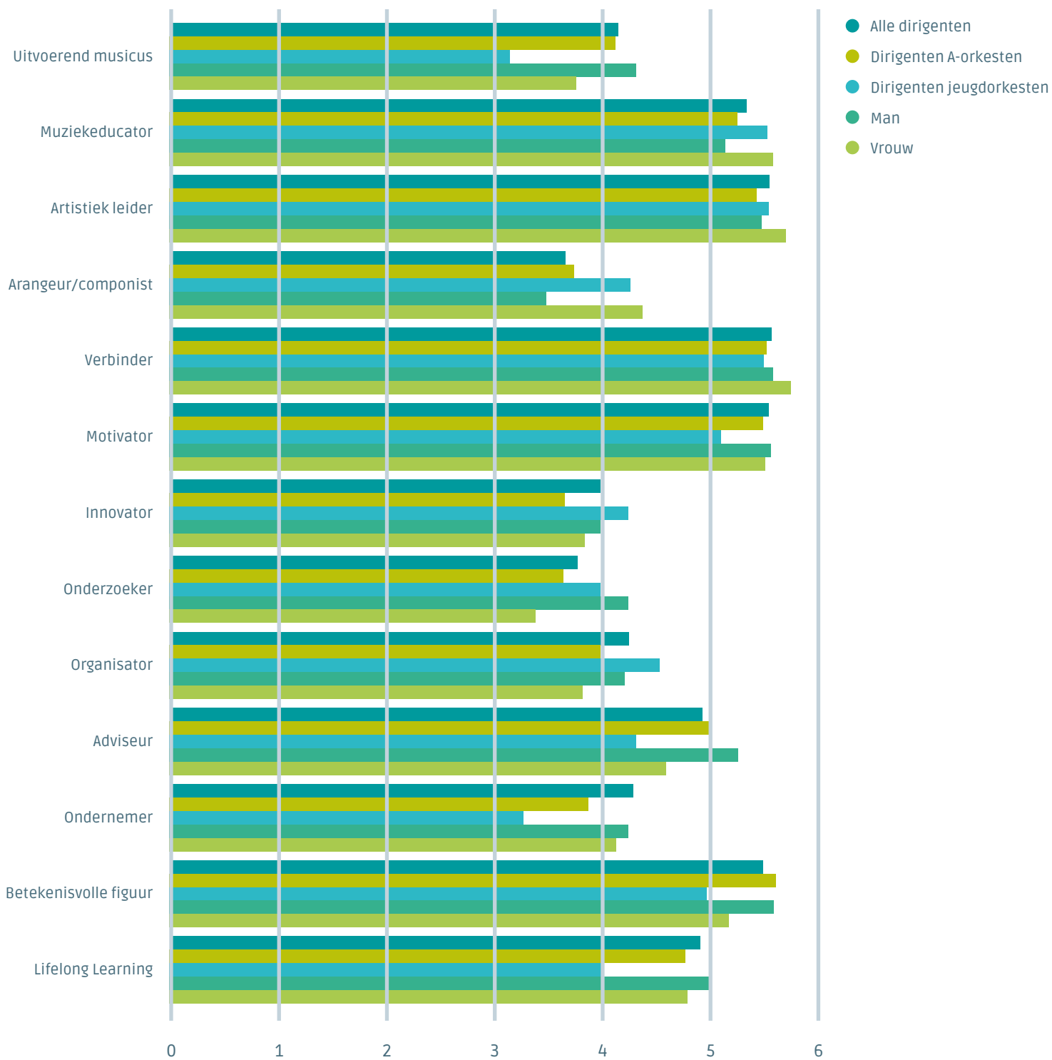
FIGUUR 2: ROLIDENTIFICATIE DIRIGENTEN (SCHAAL 1-6)