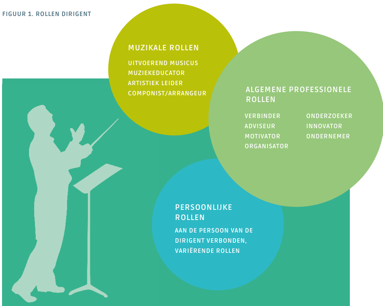
FIGUUR 1. ROLLEN DIRIGENT

Rollen vormen zich in het contact met anderen en in een vooral onbewust en intuïtief verlopend proces. Bij de herhaaldelijke bevestiging van een rol in het contact met anderen ontstaat rolidentificatie. Musici zijn tegenwoordig actief in nieuwe contexten en in nieuwe rollen. 6 Dit geldt ook voor dirigenten. Met name bij veranderingen schakelen dirigenten tussen rollen en nemen ze nieuwe rollen aan. Wanneer er rollen bijkomen of deze een ander accent krijgen, is er sprake van roltransitie. Roltransities maken ontwikkeling mogelijk, zowel voor de roleigenaar zelf als voor zijn omgeving. 7 Voor de toekomst van de HaFaBra-sector zijn roltransities bij dirigenten en kennis daarover dan ook cruciaal.