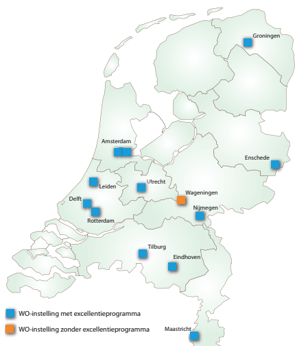
Kaart 1. Aanbod excellentieprogramma's op WO-instellingen (2009-2010)