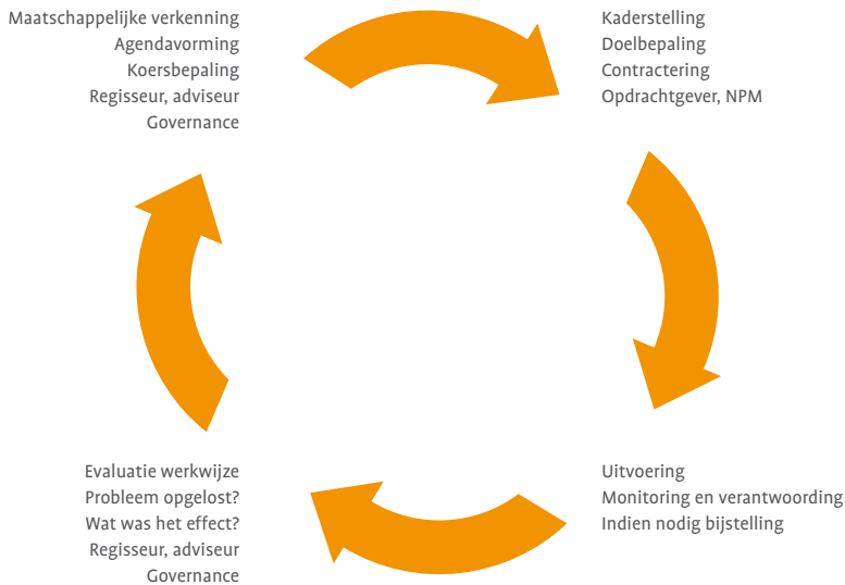
Figuur 4 - De beleidscyclus

De beleidscyclus bestaat uit vier fasen (er zijn meer fasen te onderscheiden, maar we beperken ons hier tot de vier hoofdfasen) 2 :