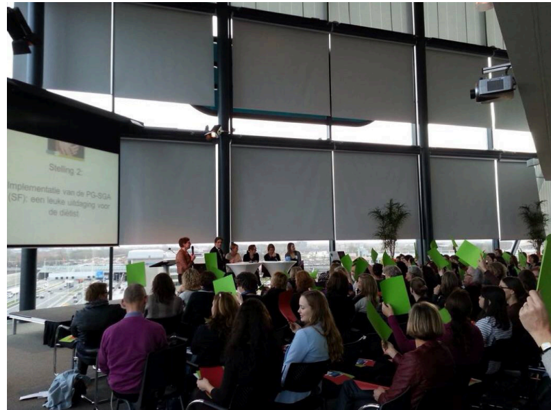
Figuur 3. Landelijke Werkgroep Diëtisten Oncologie

Ik vind het mooi om te zien dat ook de diëtisten in Nederland de implementatie van de PG-SGA zien als een belangrijke ontwikkeling en een leuke uitdaging! Op de bovenste foto (Fig. 2) ziet u dat de deelnemers van het onlangs georganiseerde symposium over de PG-SGA en de Pt-Global app dit beamen. Op de onderste foto (Fig. 3) ziet u de Landelijke Werkgroep Diëtisten Oncologie, die de PG-SGA kortgeleden heeft uitgeroepen tot voorkeursinstrument voor screening en diagnostiek van ondervoeding.