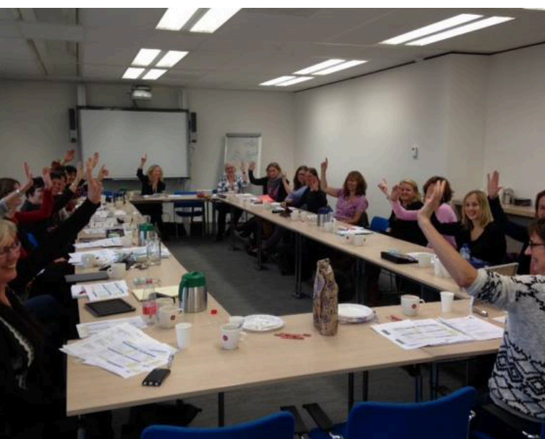
Figuur 2. Symposium Nutritional assessment: een behoefte vanuit professional en praktijk (Utrecht, december 2014)

Ik vind het mooi om te zien dat ook de diëtisten in Nederland de implementatie van de PG-SGA zien als een belangrijke ontwikkeling en een leuke uitdaging! Op de bovenste foto (Fig. 2) ziet u dat de deelnemers van het onlangs georganiseerde symposium over de PG-SGA en de Pt-Global app dit beamen. Op de onderste foto (Fig. 3) ziet u de Landelijke Werkgroep Diëtisten Oncologie, die de PG-SGA kortgeleden heeft uitgeroepen tot voorkeursinstrument voor screening en diagnostiek van ondervoeding.