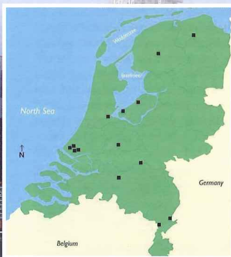
Overzichtskaart: Eerste inventarisatie van drijvende woningen in Nederland (Buck en van der Linden, 2014).

Drijvend bouwen is de meest vergaande vorm van flexibele verstedelijking. Drijvende wijken zijn in principe aanpasbaar, verplaatsbaar en flexibel. Zo kan een drijvende wijk zich aanpassen aan een stijgende zeespiegel. In Nederland kan drijvend bouwen op twee manieren bijdragen