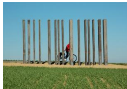
Kunsttoepassing langs de route