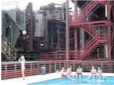
Zwembad Zollverein Essen

energiemogelijkheden van het gebied benut. Het progressieve en culturele imago wordt nog verder versterkt door de verkiezing tot Europese culturele hoofdstad: Ruhr 2010.