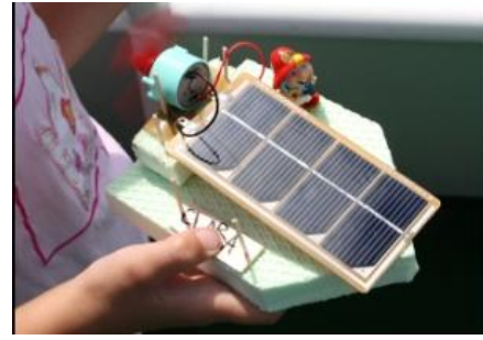
Activiteiten voor kinderen