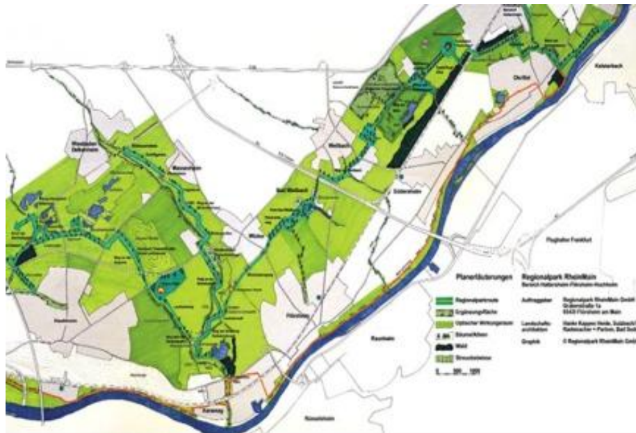
Uitwerking van het eerste deelgebied

enorm veel verschillende partners: een koepelorganisatie, uitvoerende organisaties, gemeenten, sponsors, verenigingen en burgers.