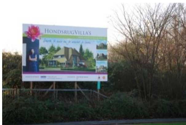
Hondrugvilla's in de stad Groningen

In de hierop aansluitende periode van postindustrialisatie veranderde de verhouding tussen de drie sectoren landbouw, industrie en dienstverlening. Terwijl in de 19 e eeuw het aandeel van werknemers in de landbouw afnamen ten opzichte van de industrie, zijn nu steeds meer mensen in de tertiaire, de dienstverlenende sector werkzaam. De meeste mensen in onze samenleving hebben geen directe relatie meer met het landschap, niet met het kleinschalig cultuurhistorisch landschap, niet met het grootschalig industrieel landschap. Het postindustriële landschap kenmerkt zich door het vervagen van de grenzen tussen stad en land en door de gelijktijdigheid van schijnbaar tegengestelde processen: bedrijfsgebieden in het landelijk gebied, landelijk wonen in de stad of de prioritering en ontwikkeling van natuurgebieden naast de ondersteuning van de intensivering in de bio-industrie zoals de megastallen voor 1000 koeien. Er ontstaat een gelijkvormige veelvuldigheid, een homogene heterogeniteit die steeds verder verwijderd is van een karakteristiek en identiteitsverlenend landschap.