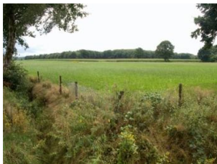
Verhoging van de es