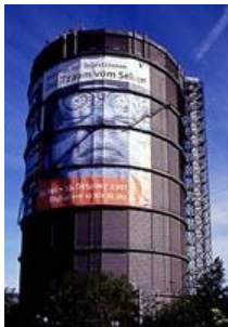
Gasometer Oberhausen: tentoonstellingen