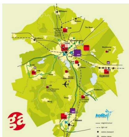
Regio Groningen Assen

De Regiovisie Groningen-Assen heeft grote plannen in de regio. In een gebied van Assen tot Winsum, van Zuidhorn tot Sappemeer zal een zogenaamd regiopark ontstaan. Het Regiopark zal de concurrentiepositie en vestigingsaantrekkelijkheid van de regio ten goede komen, want voor de toekomst van de steden Groningen en Assen is niet alleen de hoeveelheid en kwaliteit van de arbeidsplaatsen van economisch belang maar ook de kwaliteit van het landschap rondom die steden. Groningen en Assen kunnen zich niet onttrekken aan de internationale jacht op hooggekwalificeerde werknemers, en daarbij zijn ook de zachte factoren als het aanbod in vrijetijdsbesteding, de mentaliteit van de bevolking of het voorhanden zijn van goed onderwijs van wezenlijk belang. De verbetering van recreatiemogelijkheden en toegankelijkheid van het landschap zal de komende jaren door het ontstaan van een Regiopark ondersteund worden.