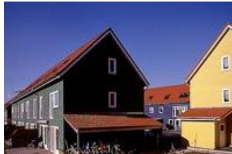
Zelfbouwproject in Herten