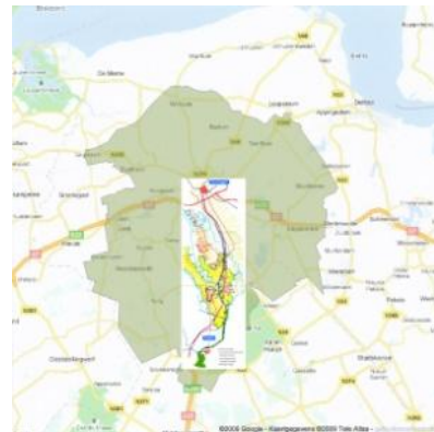
Regio Groningen Assen

In 1994 besloot het 'Umlandverband Frankfurt' tot de start van het project, Regionalpark RheinMain. Met dit project werd een hele reeks aan doelen vastgelegd. Allereerst zouden de mensen in het gebied een aantrekkelijk vrijetijdsaanbod in de directe omgeving aangeboden moeten krijgen. Verder zouden de bestaande kleine open stukken land en groenstroken niet langer met passieve beschermingsregels in stand gehouden moeten worden maar door een actief landschapontwerp ontwikkeld worden. Het landschap zou ecologisch, esthetisch en typisch voor de regio moeten zijn. De positie van het RheinMaingebied in de internationale concurrentiewedloop zou door de opwaardering van het landschap verbeterd moeten worden. Lokale activiteiten werden deel van een netwerk dat de uitstraling van de gezamenlijke regio versterkt.