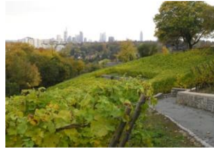
Wijngaard ten Noorden van Frankfurt