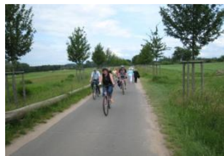
nieuwe beplanting langs de weg