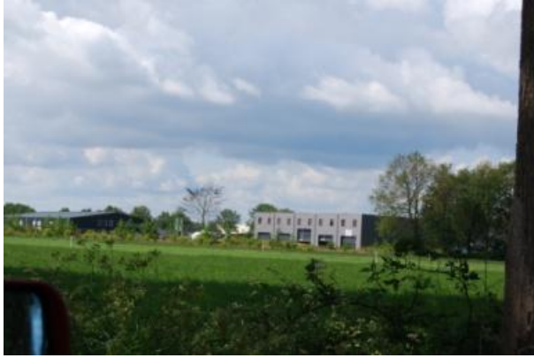
Het bedrijventerrein op de es van Tynaarlo

Een andere duidelijke ontwikkeling is de steeds groter wordende claim door de recreant: de groepjes zondagwielrenners en uitstapjesmens ontwikkelen eigen ideeën over hoe hun landschap er uit dient te zien. De argumenten worden gebaseerd op zowel de economische betekenis van het landschap voor zowel het toerisme als de landbouw. Terwijl het aantal werknemers in de landbouw steeds verder terugloopt, is de vrijetijdsindustrie een groeimarkt. Landbouw verliest haar bestaansrecht als ze door het negeren van het cultuurhistorische erfgoed de schoonheid van het (cultuur)landschap vernietigt. 3 De sociologe Hartmut Rosa ziet tegen de achtergrond van individualisering en de acceleratie waar onze samenleving zich in bevindt aanwijzingen voor het ontstaan van een gebruikerstype van het landschap dat alleen korte termijn verwachtingen bezigt en een onmiddellijke bevrediging als uitgangspunt neemt, terwijl langdurige duurzame betrokkenheid werkelijk vruchten af zou werpen. Het landschap zou een belevingsrijkdom moeten bieden zonder enige kennis vooraf.