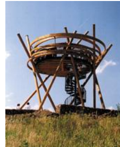
Het Vogelnest, een nieuwe uitzichtoren

Het wegennet vormt het kader waarin ook lokale initiatieven kunnen aanhaken. Het gebruik van het bestaande cultuurlandschap blijft voornamelijk in tact. Landbouwactiviteiten horen onwillekeurig tot de vrijetijdsbeleving van de regiopark gebruikers. Het wegennetwerk raakt niet allen aan agrarische gebieden en gebouwen maar ook industrie- en bedrijfsgebieden of woonwijken. Deze dissonanties binnen en langs de recreatieve route worden niet als zodanig ervaren.