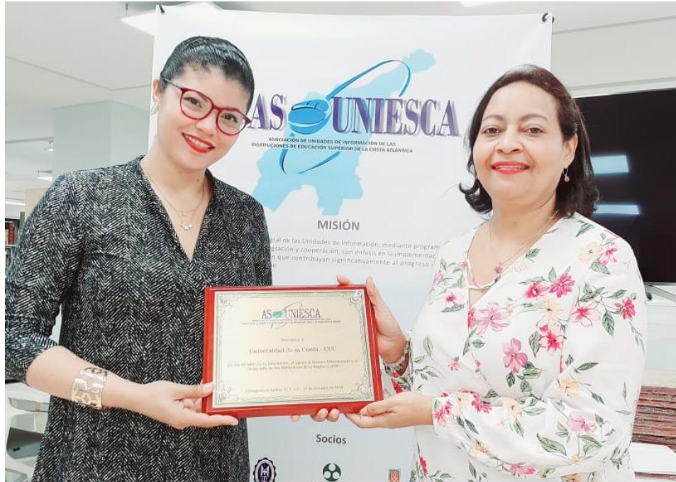
Entrega de placa a Dir. Universidad de la Costa. ASOUNIESCA. Octubre 2019