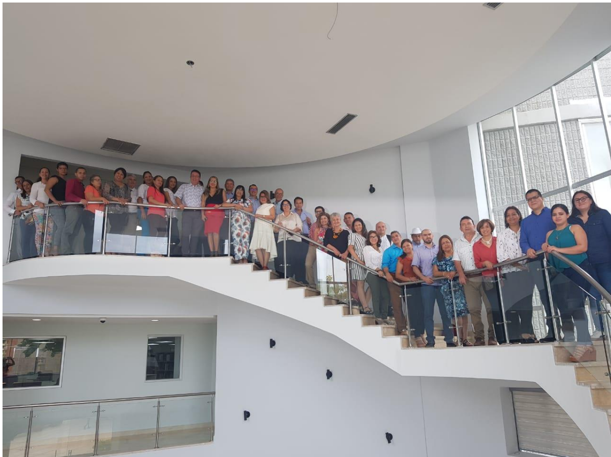
Representantes asistentes al evento ASOUNIESCA. Octubre 2019