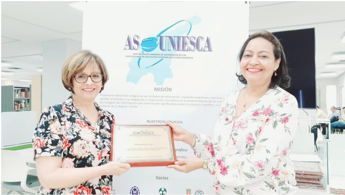
Entrega de placa a Dir. Universidad Libre. ASOUNIESCA. Octubre 2019