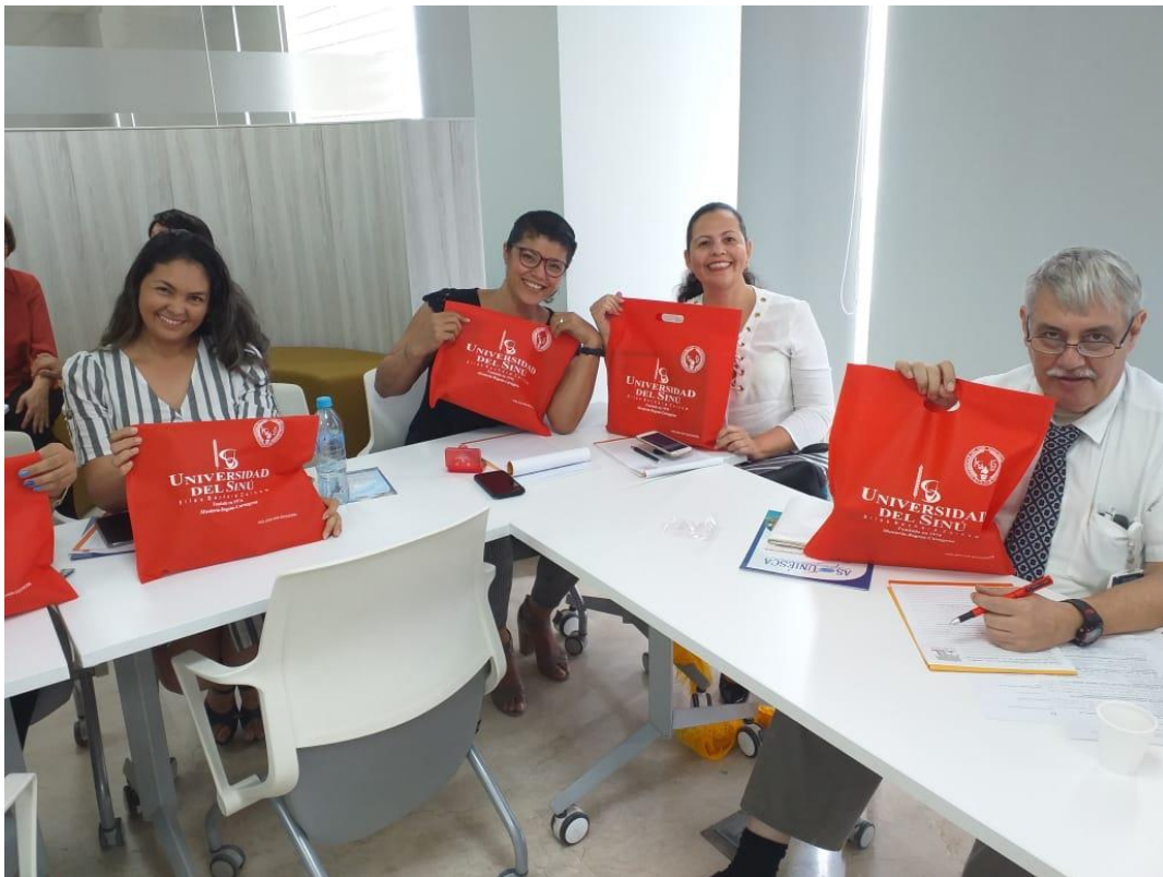
Miembros de la organización con souvenirs. ASOUNIESCA. Octubre 2019