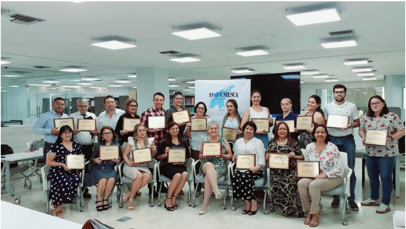
Directores con sus Placas. ASOUNIESCA. Octubre 2019