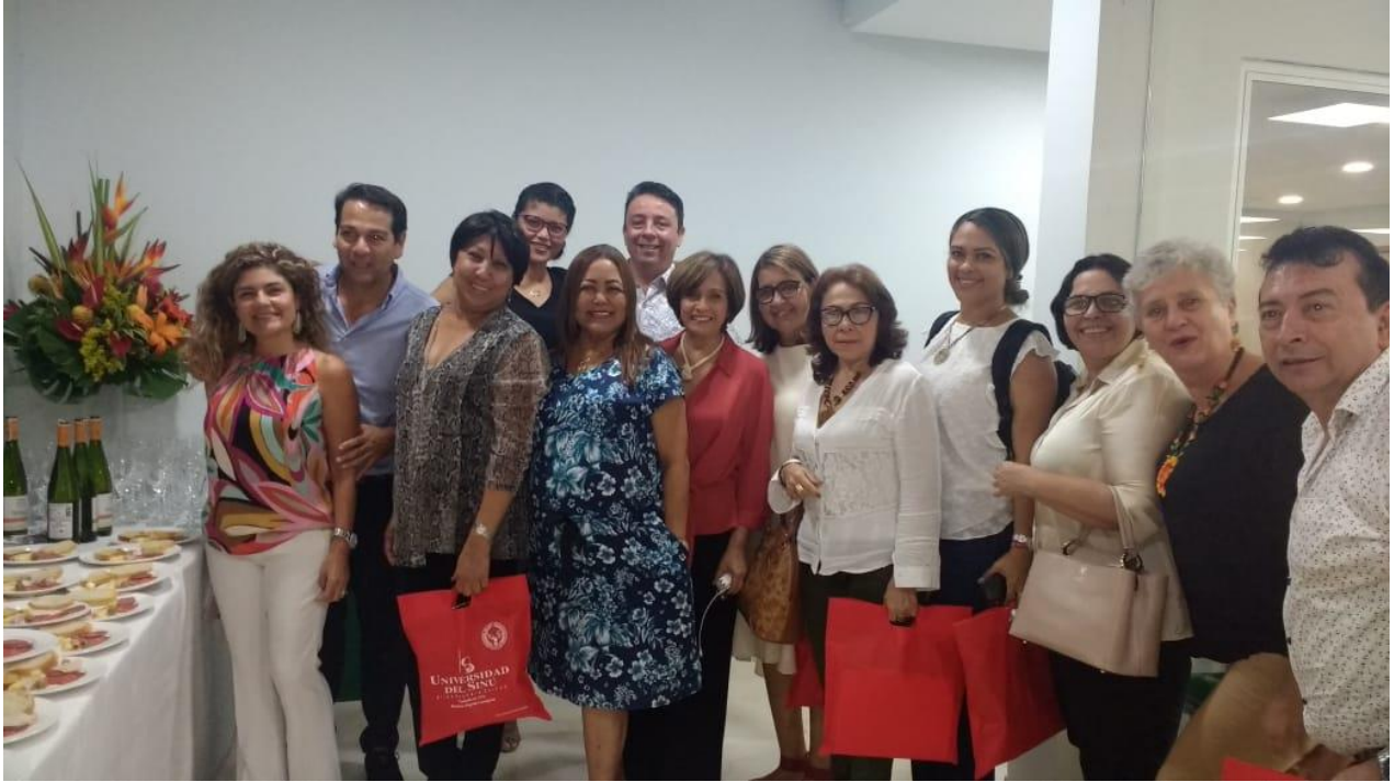
Participantes y proveedores aliados. ASOUNIESCA. Octubre 2019