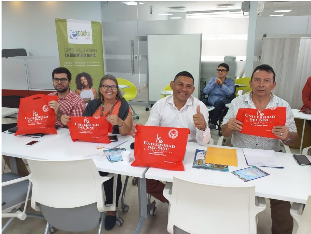
Miembros de la organización con souvenirs. ASOUNIESCA. Octubre 2019