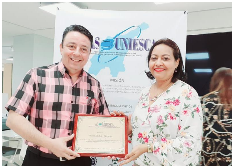
Entrega de placa a Dir. Universidad del Atlántico. ASOUNIESCA. Octubre 2019