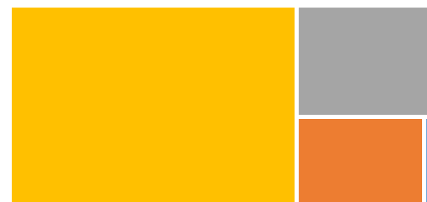
Figura 1. Acciones armadas por subregión: enero-septiembre, 2018.