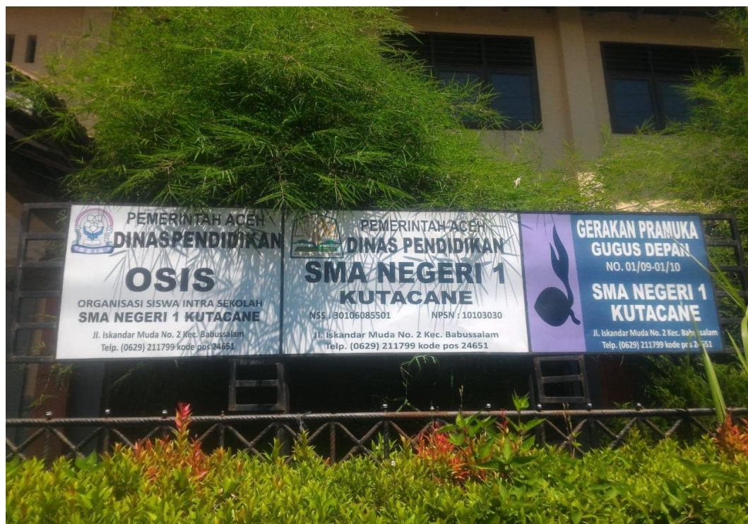
Gambar 2. Plank Organisasi Sekolah SMA Negeri 1 Kutacane Tahun 2019