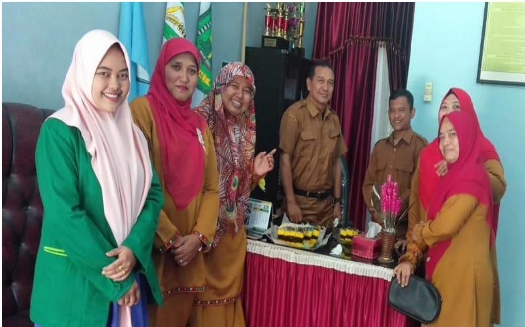
Gambar 6. Peneliti dengan beberapa Dewan Guru SMA Negeri 1 Kutacane