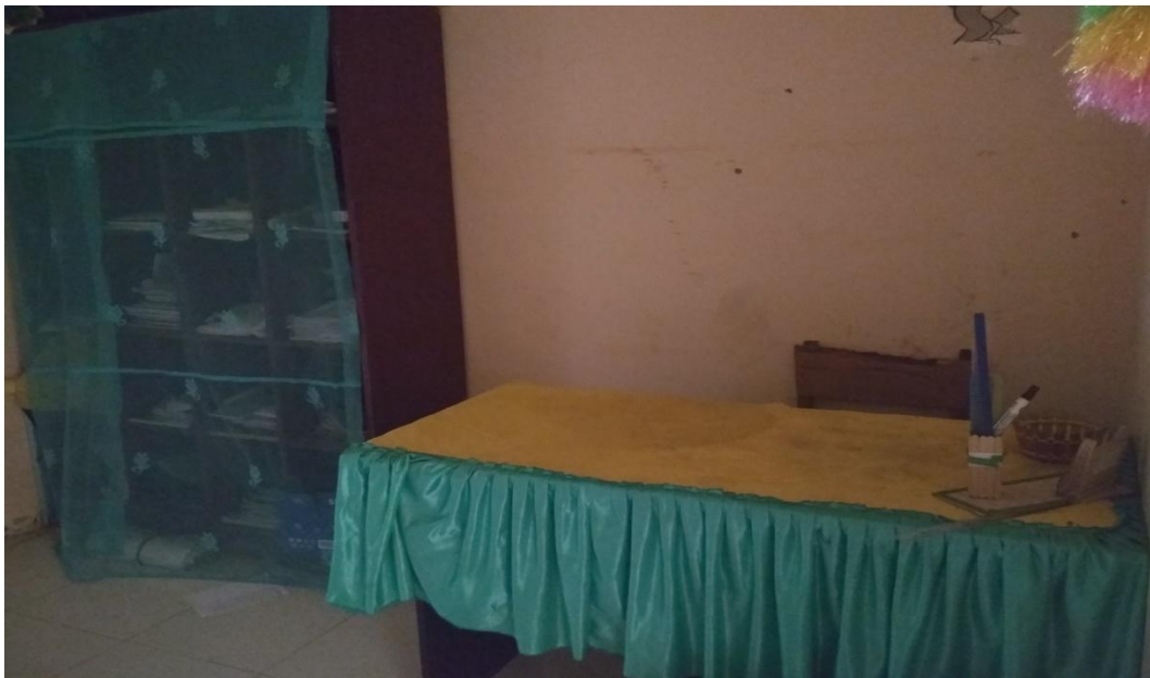
Gambar 8. Ruang Konseling SMA Negeri 1 Kutacane