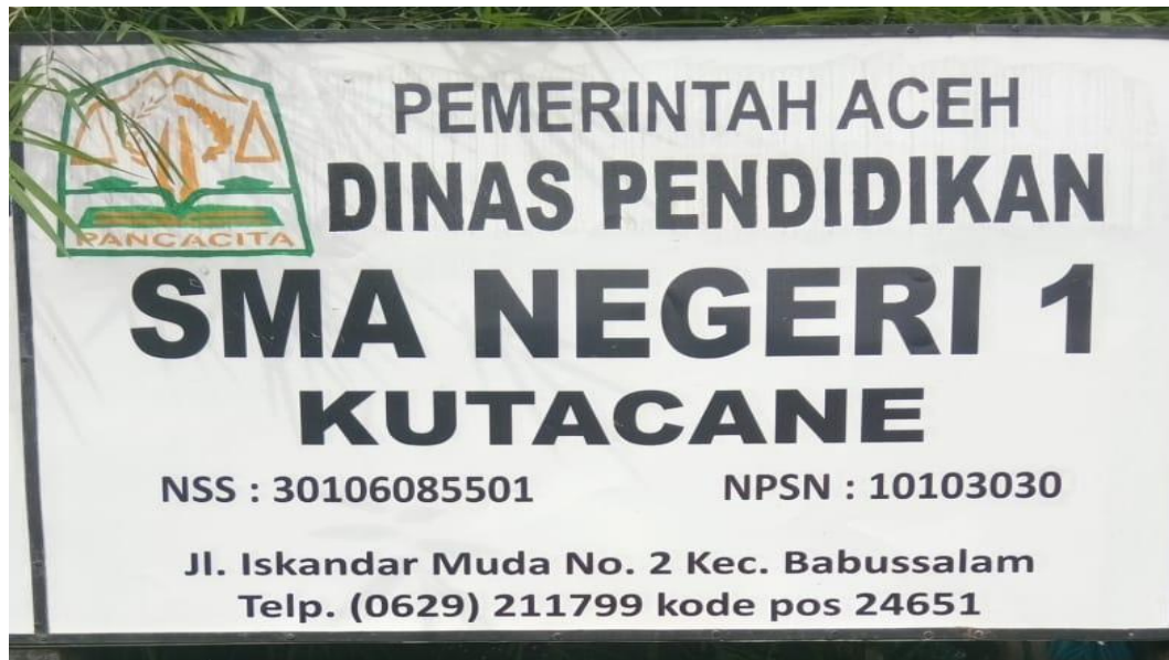
Gambar 1. Plank Sekolah SMA Negeri 1 Kutacane Tahun 2019