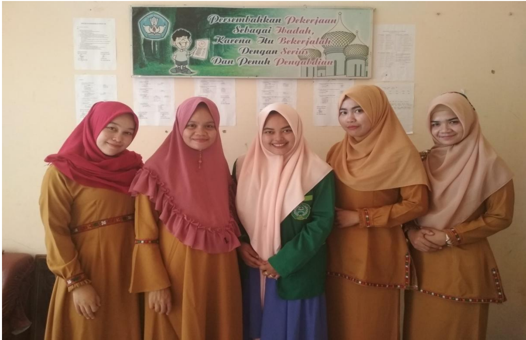
Gambar 5. Peneliti dengan guru BK SMA Negeri 1 Kutacane