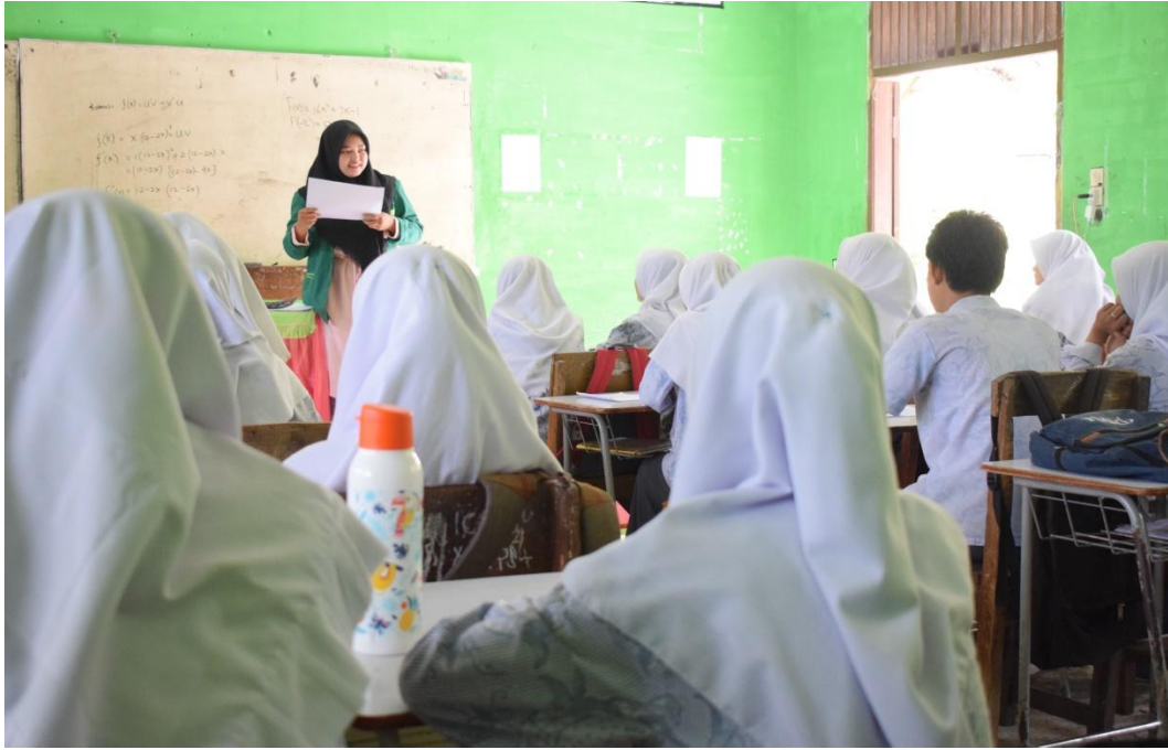
Gambar 7. Peneliti saat memberikan Himpunan Data di kelas XI IPA