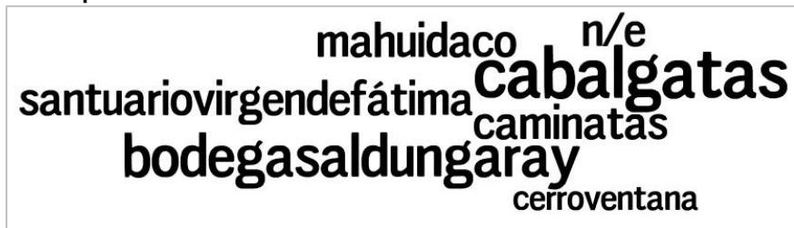
Figura N° 4. Principales excursiones 8

*n/e: no específica, implica que los entrevistados han realizado gran parte de las visitas guiadas y excursiones mencionadas en la encuesta.