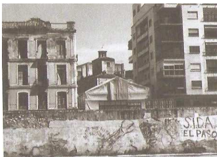
Figura 2. Fotografía de los muros del río Guadalmedina en Málaga, en los que se lee “S.i.d.a. el paso” y “No nos llega ni el Sida”. Finales de la década de 1980.