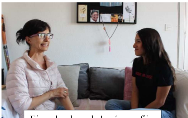
Ejemplo plano de la cámara fija.