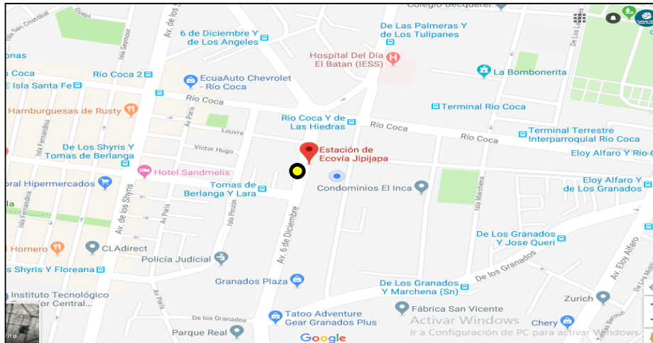
Figura 1. Ubicación de la Fundación CAVAT Nicole Paredes. Tomada de (Google Maps, 2019).