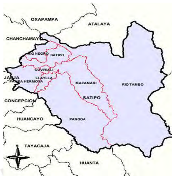
Figura N° 1: Mapa del distrito de Pangoa, Satipo.