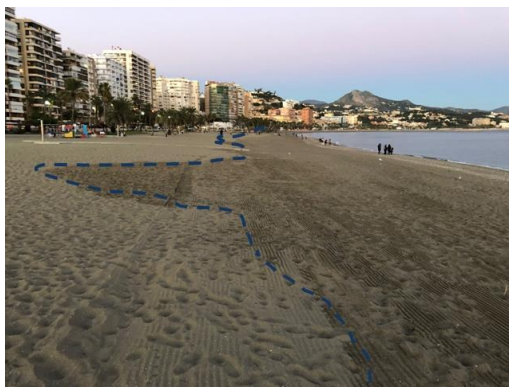
Figura 2. Alcance máximo en un tramo de playa tras un temporal. Observar la irregularidad de la línea que define el alcance (playa de la Malagueta, Málaga, Diciembre de 1988).

Propuesta y recomendaciones para la delimitación de la Zona Marítimo Terrestre de playas abiertas con baja carrera de marea según la legislación vigente.