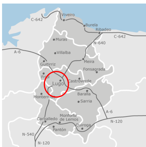
Ilustración 1: Localización geográfica del ámbito de estudio. Elaboración propia a partir de datos de Google Maps

El proyecto se llevará a cabo en los colegios e institutos públicos de educación ordinaria de la ciudad de Lugo (Ilustración 1). Para acceder a los participantes, así como a sus familias, se contará con la colaboración de dos asociaciones para personas con TEA y/o Trastorno de Comunicación Social (TCS): Raiolas y Capaces . Para ello, se establece un contacto telefónico inicial con cada una de ellas.