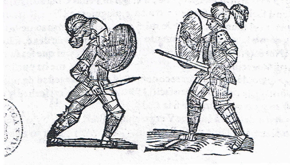
Fig. 1. Cartel de desafío (Valladolid, Gregorio de Bedoya, 1641). Colofón.

Con licencia, En Valladolid por Gregorio de Bedoya, 1641.