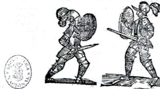
Figs. 2-3. Cartel de desafío (Valladolid, Gregorio de Bedoya, 1641)

Conlicencia, En Valladolid por Gregorio de Bedoya, 1641.