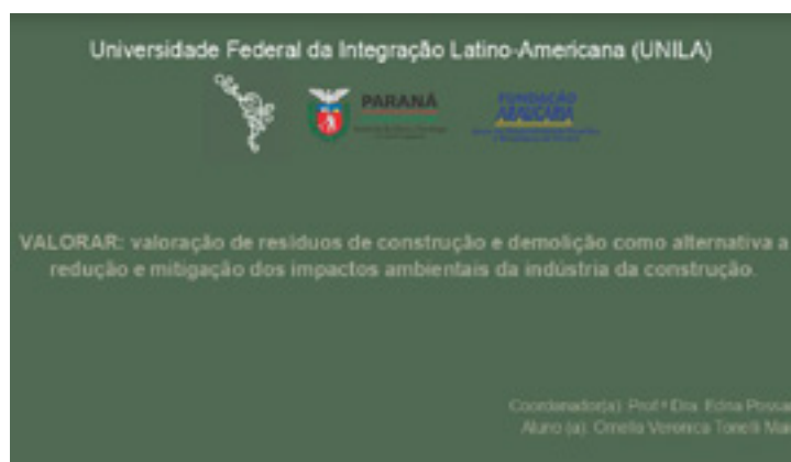
Figura 1 Material didático desenvolvido para apresentações em formato de Power Point

Para etapa inicial de projeto, as pesquisas bibliográficas deram origem a um material didático, o qual serve de base para apresentações a comunidade escolar e geral da região, e também, publicações em uma página nas redes sociais, em que serão apresentados conteúdos programáticos sobre resíduos e sobre o projeto. Através da página, pretende-se atingir e informar um maior número de pessoas, onde as postagens serão sucintas, diretas e o mais claras possíveis, do tipo: o que é o RCD, como é produzido, onde é descartado, como pode ser reaproveitado, além de incluir tutoriais para que as pessoas possam produzir objetos com resíduos, por conta própria.