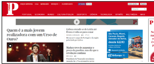
Figura 1 – Página Web que simula a autenticação com senha gráfica

alfanumérica, tal como a presença das duas caixas de autenticação indicia ao utilizador.