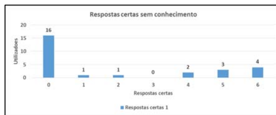
Figura 7 - Respostas certas sem conhecimento do teste

Na Figura 7, é possível verificar que a maioria dos participantes (59%), correspondentes a dezasseis em vinte e sete, não conseguiu reproduzir corretamente nenhum dos segmentos de reta, e que somente quatro utilizadores reproduziram corretamente os seis segmentos de reta.