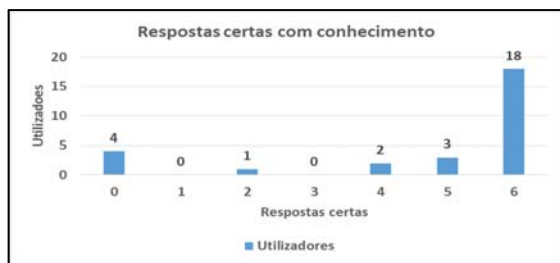
Figura 8 – Respostas certas com conhecimento dos objectivos do teste

Estes resultados são bastante positivos, e mostram que quando a maioria das pessoas são motivadas para memorizar esta informação visual, conseguem posteriormente recuperá-la de forma eficaz.