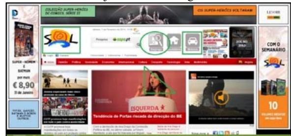
Figura 4 – Exemplo de registo de objetos gráficos sobre imagem de página Web

Usando a aplicação de desenho MSPaint tm , catorze participantes do teste criaram oito objetos (polígonos, segmentos de reta, ou círculos) sobre a imagem de uma página Web, na sequência e nas posições pretendidas, conforme é mostrado na Figura 4. Foi-lhes pedido que memorizassem essas ações, para as tentarem reproduzir, passadas seis horas, com a mesma sequência e o mesmo posicionamento dos objetos sobre a imagem.