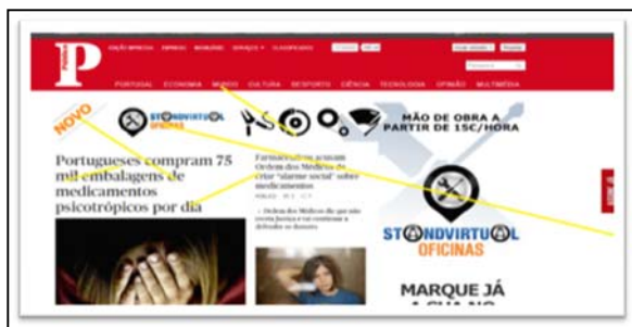
Figura 6 – Desenho dos segmentos de recta sobre a imagem

Manteve-se o conceito da imagem de fundo que permite que, diferentes utilizadores, registem diferentes imagens na sua conta de utilizador do sistema.