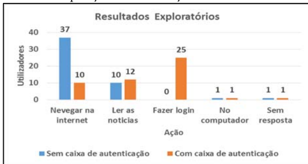
Figura 3 – Resultados do inquérito da simulação do espião de ombro nos cenários da senha gráfica e alfanumérica

Os resultados mostrados na Figura 3 mostram que não é claro para um espião do ombro, que o utilizador esteja a efetuar uma operação de autenticação, se ele não recorrer ao padrão comum da autenticação baseado na senha alfanumérica. Por outro lado, usando esta técnica, é evidente, para a maioria dos espíões de ombro, que o utilizador está a efetuar uma operação de autenticação.