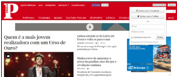
Figura 2 – Página Web que simula a autenticação da senha alfanumérica

Na sequência da inquirição feita aos participantes, verificou-se para o caso da simulação do cenário da senha gráfica, que nenhum dos quarenta e nove indivíduos percecionou que o utilizador estava a fazer uma operação de autenticação. Por outro lado, a maioria deles (76%) responderam que o utilizador estava simplesmente a navegar na internet. Relativamente à simulação do uso da senha alfanumérica, vinte e cinco (51%) dos sujeitos responderam que o utilizador estava a realizar uma tarefa de autenticação.