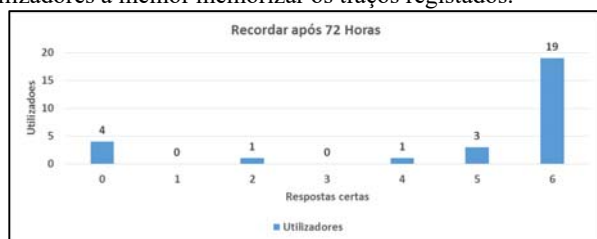
Figura 9 – Resultados do teste de memória de longa duração

Como se pode analisar na Figura 9, 67,9% (dezanove em vinte e oito) dos participantes acertaram a posição dos seis segmentos de retas. Mas, por outro lado, quatro utilizadores (14,2%) não acertaram em qualquer um dos segmentos de reta. Isto pode indiciar que haverá um leque de pessoas, que poderá ter dificuldades na memorização deste tipo de informação gráfica. Isto pode motivar encontrar novas soluções, que podem passar por disponibilizar pistas visuais nas imagens de fundo da senha, que ajudem estes tipos de utilizadores a melhor memorizar os traços registados.