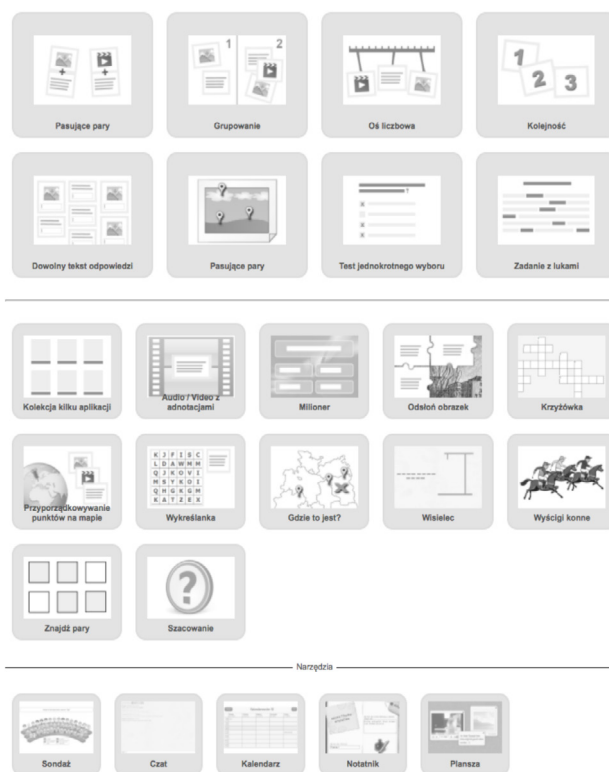
Ryc. 3. Zrzut ekranu z aplikacji LearningApps prezentujący silniki zadań

Twoim zadaniem jest stworzenie 5 różnych zadań przy wykorzystaniu 5 różnych silników. Wybierz te, które będą najbardziej pasowały do wieku uczniów i treści, które chcesz utrwalić. Następnie wpleć część z tych zadań w różne inne scenariusze, a część udostępni uczniom poprzez Edmodo do samodzielnej pracy (np. powtórki przed sprawdzianem).