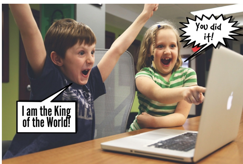
Ryc. 4. Przykładowe zdjęcie z dołożonymi podpisami (chmurkami dialogowymi)

Zastanów się, w jaki jeszcze inny sposób możesz wykorzystać to narzędzie do nauczania języka angielskiego. Wypisz te pomysły i podziel się nimi z Mentorem.