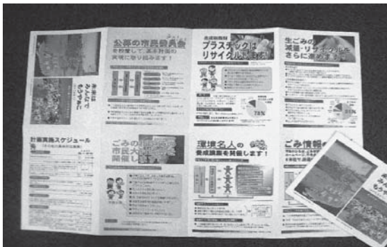
図1 津島市のごみ処理基本計画

津島市が基本計画策定のために2年間に渡って実施した市民参加プロジェクトは、公募の市民委員会、ごみ組成調査、ごみ減量先進地域の視察、専門家の講演会、市民の要望を収集するフォーラム、計画案のパブリックコメント、計画やごみ排出ルールに関するごみ新聞の発行などであった。全ての催しは広報などで市民に通