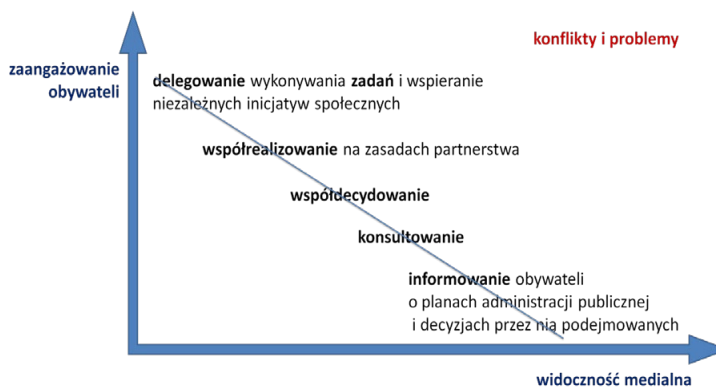
Rysunek 3. Poziom zaangażowania obywateli a widoczność medialna poszczególnych poziomów dialogu obywatelskiego

niektóre organizacje też nie chcą się za bardzo łączyć, żeby później uniknąć łatki, że są miejskie, że są opłacane przez miasto, że ktoś na nie wpływa (D9).