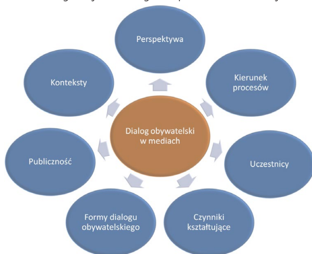
Rysunek 2. Kategorie analizy medialnych reprezentacji dialogu obywatelskiego w opiniach dziennikarzy

W analizie wypowiedzi dziennikarzy wyodrębniono siedem głównych wątków, które pojawiły się w tych narracjach i dotyczyły opinii na temat medialnego obrazu dialogu obywatelskiego (rys. 2.). Należą do nich: główne konteksty prezentowania rzeczowej tematyki, dominująca perspektywa narracji, najczęściej występujący kierunek opisywanych procesów, częstotliwość i charakter występowania poszczególnych aktorów dialogu obywatelskiego, czynniki kształtujące medialny obraz dialogu obywatelskiego, występowanie zróżnicowanych form dialogu obywatelskiego oraz rola odbiorców.