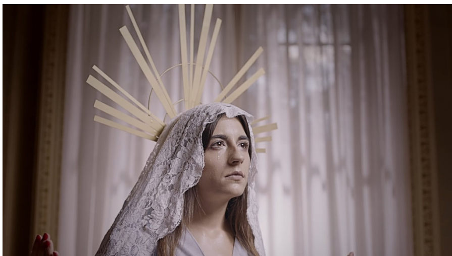
Figura 2. Fotograma del spot "Patria" (C. Valdés, VIMEMA Productions, 2016). Clarísimas referencias visuales y artísticas, como el caso de la imaginería religiosa barroca.

un anuncio que, precisamente, tiene un aire completamente artístico basado en el metadiscursos. Es arte (publicitario) que cita al arte (clásico). Sobre la base de esa escena encontramos la representación de motivos artísticos, como la clarísima referencia crítica a la imaginería barroca (Figura 2), en la que el plano de la acción es el contrapunto provocador a una imagen inicial que sugiere toda una realidad diegética en fuera de campo, que se omite en este texto para no herir ninguna sensibilidad.