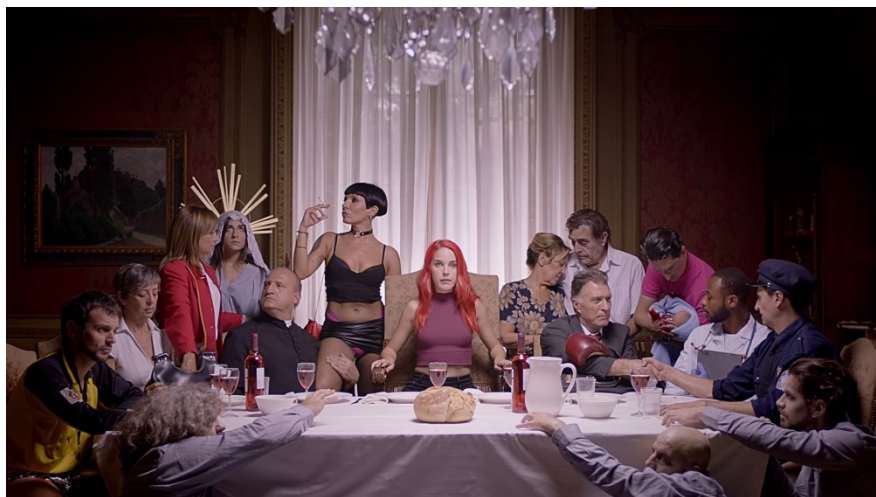
Figura 5. Fotograma del spot “Patria” (C. Valdés, VIMEMA Productions, 2016). La referencia a la religión católica es constante.

Todo un debate que trasciende el análisis audiovisual. Desde el punto de vista narrativo, el plano general, que sirve como sumario y “foto fija” final de todos los personajes, comienza a cerrar de nuevo hacia un plano más corto de la protagonista, buscando así la implicación emotiva y llamada a la acción con la que comenzaba el spot. La propia campaña, sin decirlo explícitamente, sugiere que ser libre de pensamiento puede traducirse, por qué no, en ir al Salón Erótico de Barcelona en el lugar y fecha señalada al final del spot.