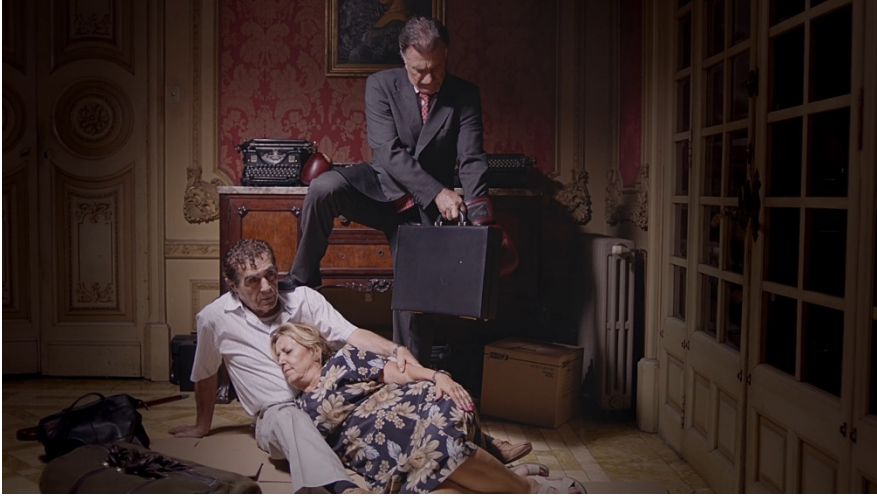
Figura 1. Fotograma del spot “Patria” (C. Valdés, VIMEMA Productions, 2016). Es la escenificación de un deshaucio.

En la complejidad secuencial que viene a representar siempre la puesta en serie, se encuentra la esencia de la narratividad (Carmona, 2000, p. 185). Es una sucesión de imágenes la que conforma el resultado final de esa “puesta en serie”. Una producción audiovisual es el resultado de valorar, por un lado, que toda la superficie de la imagen es importante; por otro, que el producto final es el resultado de una suma y una percepción global: