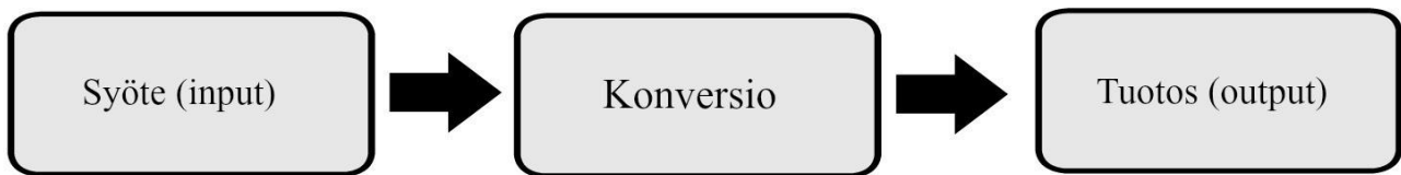
Kuvio 2: Yksinkertainen prosessimalli (Vedung 2017)

Policy 9 analyysi on väline hahmottaa poliittisia tai hallinnollisia prosesseja sekä saada tietoa itse prosessista tai sen tuotoksista. Policy-analyysin vahvuus on sen joustavuudessa ja yksinkertaisuudessa muotoutua eri konteksteihin, mikä tekee siitä tutkimuksellisesti monikäyttöisen. (Patton et al. 2016, 2, 17, 21–22; Dunn 1994, 57; Easton 1965, 34; Vedung 2017, 38–40.) Policy-analyysia kuvataan usein mallilla, joka kuvaa prosessin eri vaiheita sekä ympäristön vaikutusta prosessin syötteisiin (input), tuotoksiin (output) ja prosessin sisäiseen käsittelyyn (konversio) (Daniell et al. 2016, 3; Hogwood & Gunn 1984, 17; Easton 1965, 110–113; Knoepfel 2007, 32–34; Vedung 2017, 3). Policy-mallista on useita eri versioita, mutta Evert Vedungin (2017, 3–4) luoma malli on yksi pelkistetyimmistä ja esittää tiivistetysti prosessin eri vaiheet (ks. Kuvio 2).