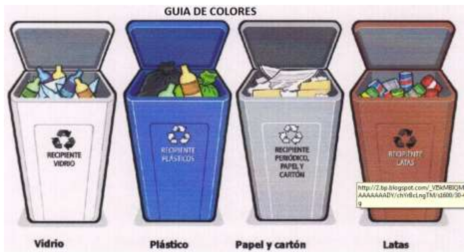
Figura 2. Recipientes para la separación en la fuente