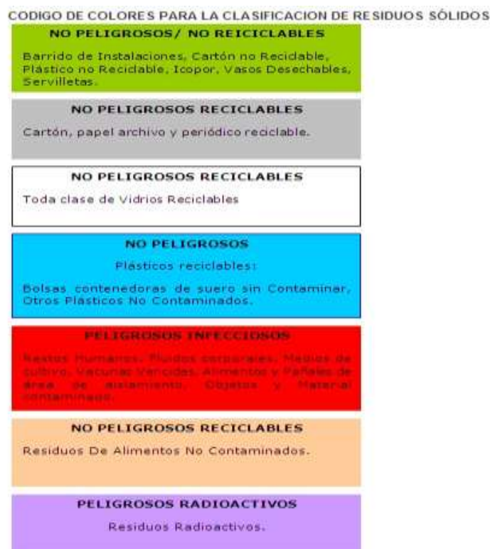
Figura 1. Código de colores