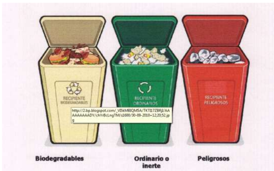
Figura 3. Recipientes para la separación en la fuente