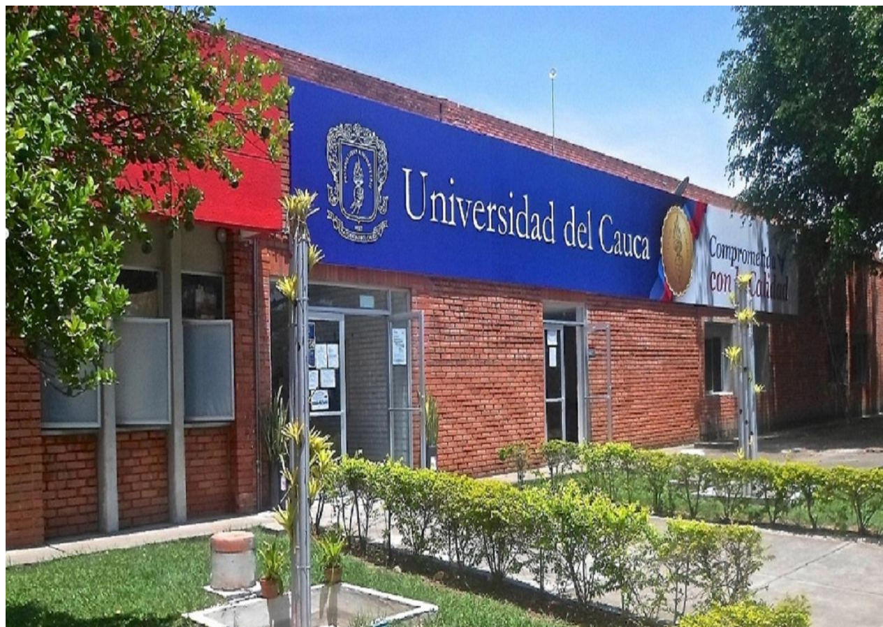
Imagen 2 Ubicación de la Universidad del Cauca en Santander de Quilichao