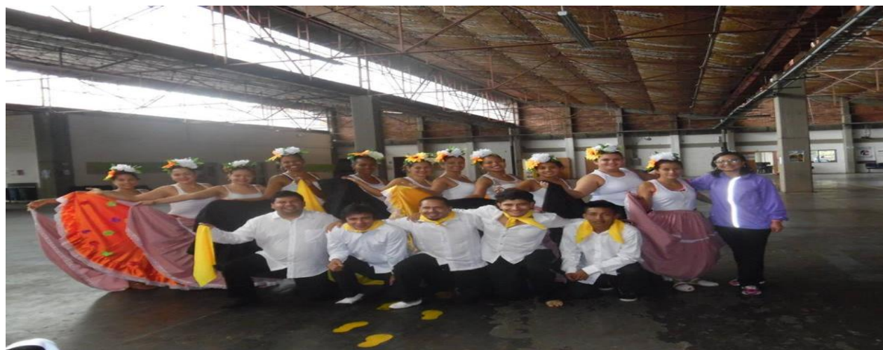
Imagen 5. Grupo de Danzas Universidad del Cauca sede Norte Santander de Quilichao