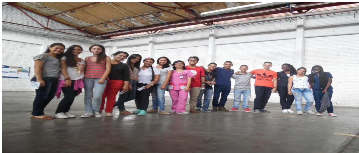
Imagen 6. Grupo de Teatro Universidad del Cauca sede Norte Santander de Quilichao