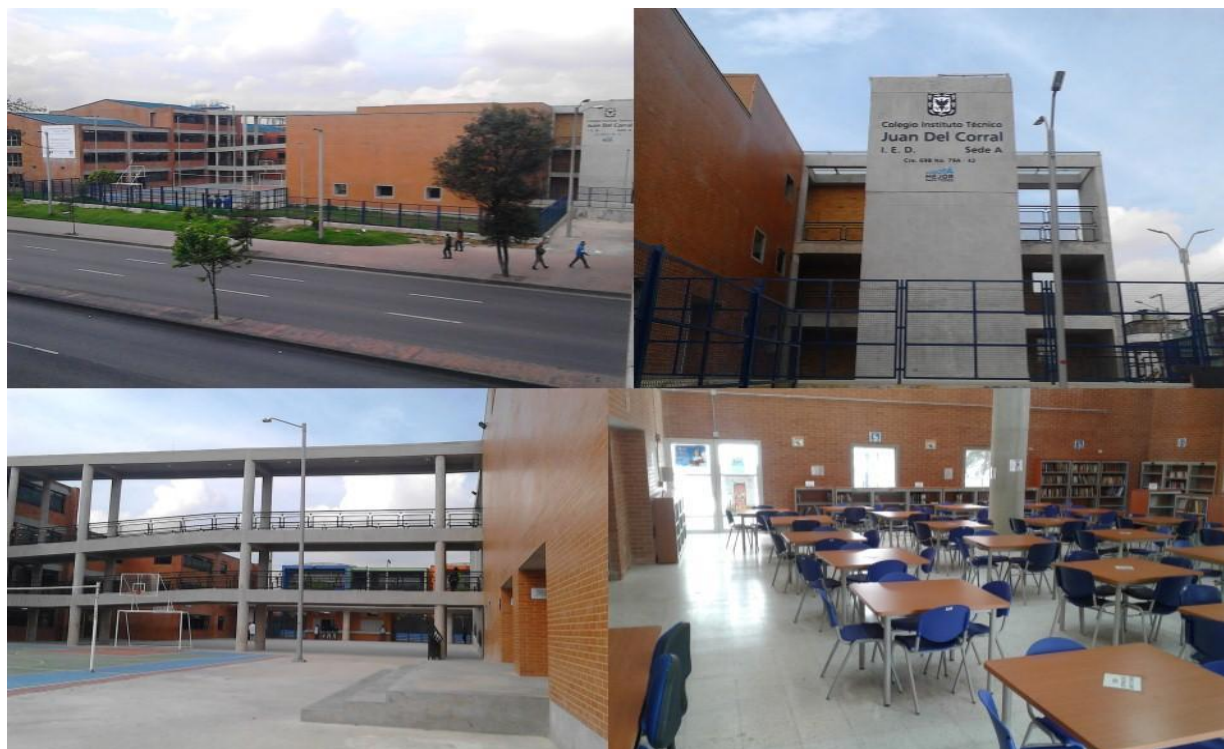
Imagen 1. Inmediaciones e interior de la biblioteca escolar

Nuevas instalaciones del ITD Juan del Corral