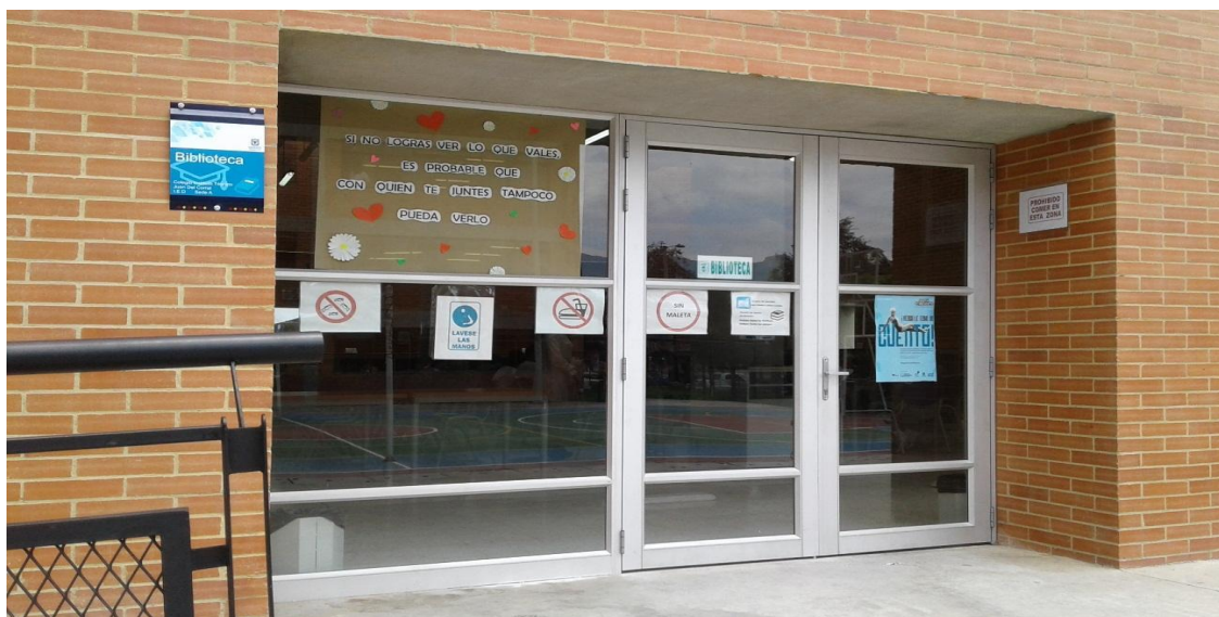
Imagen 2. Acceso a la nueva biblioteca escolar de la sede A

Entrada principal a la nueva biblioteca