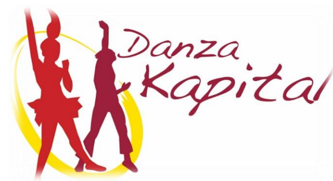
Ilustración 1. Logro Compañía Danza Kapital.