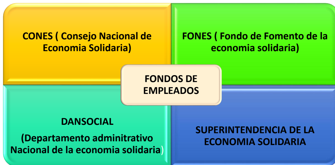
Tabla N° 2 Entidades que regulan a los fondos de empleados.