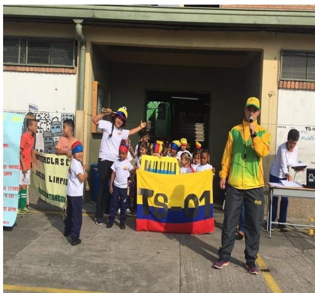
Imagen 17: Inauguración juegos Interclase