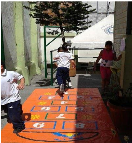
Imagen 6: Golosa gigante