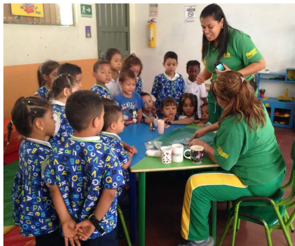
Imagen 10: Creando en la ludoteca