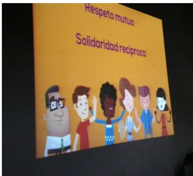
Imagen 16: Video en el bibliocanco