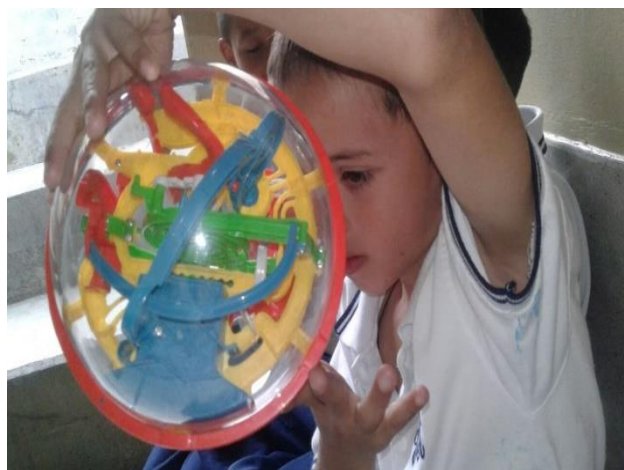
Imagen 3: Juego de laberintos