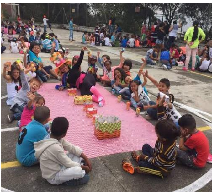
Imagen 14: Un picnic para todos