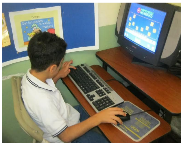
Imagen 18: Aula de apoyo