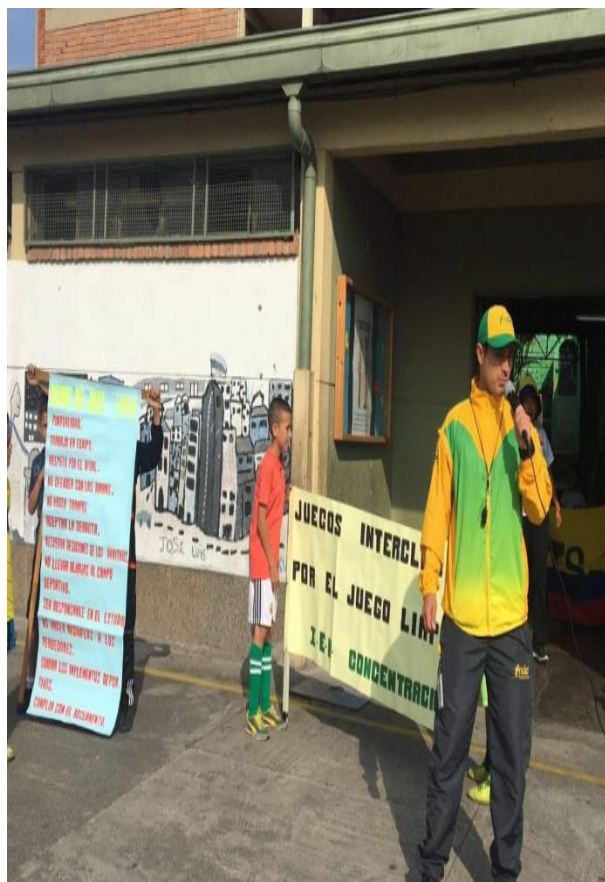
Imagen 8: Inauguración juegos interclases