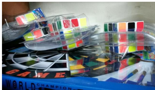
Imagen 5: Cubos de colores