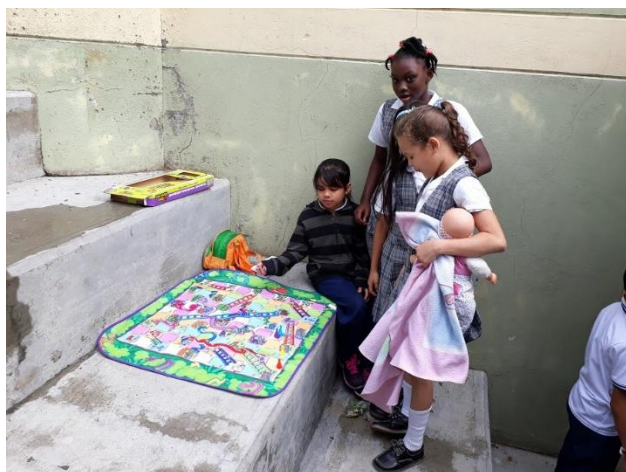
Imagen 2: juego de escalera

Anexo 5. Registro fotográfico del material concreto.