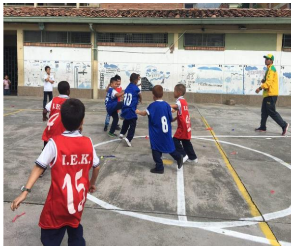
Imagen 11: juego amistoso