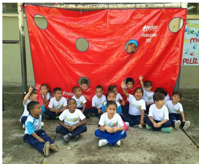
Imagen 13: juegos en el patio