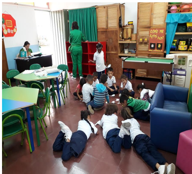
Imagen 15: Ludoteca jugando y creando