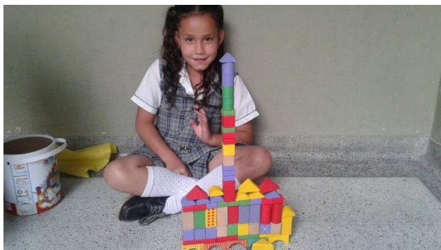
Imagen 4: Bloques de construcción