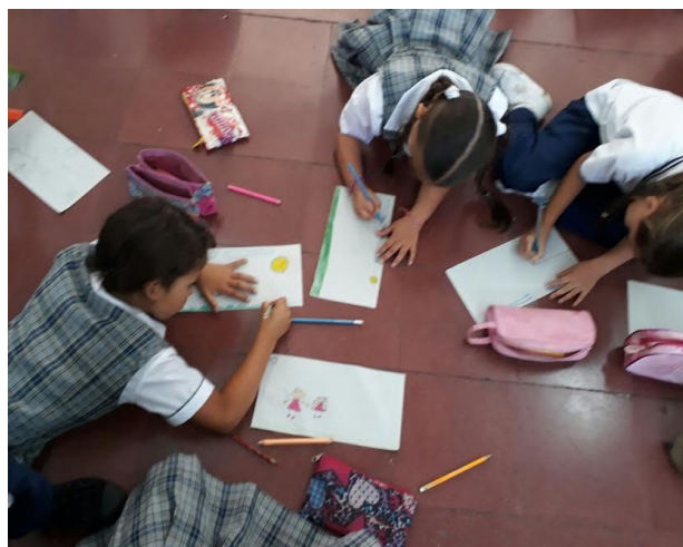
Imagen 19: Aula de apoyo.