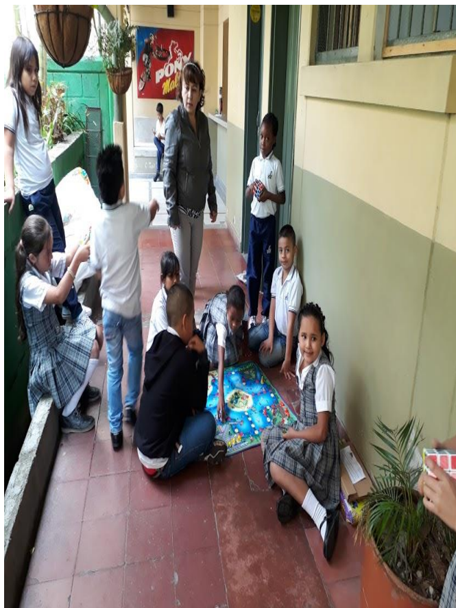
Imagen 9: juegos didáctico