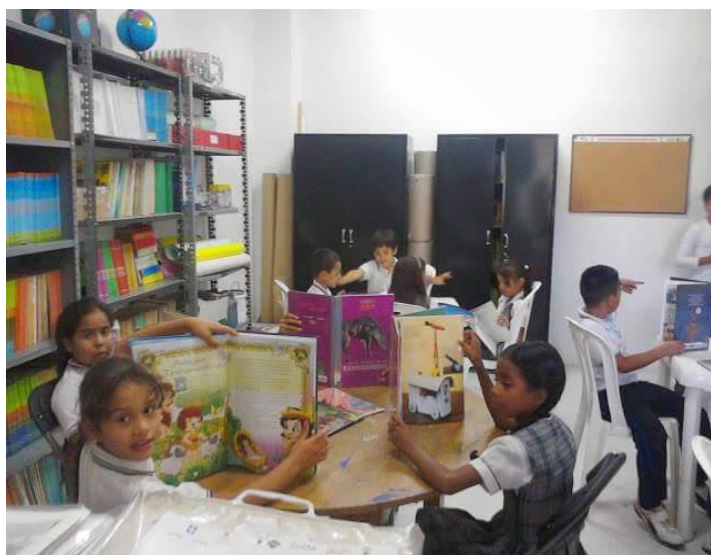
Imagen 12: bibliobanco lectura libre