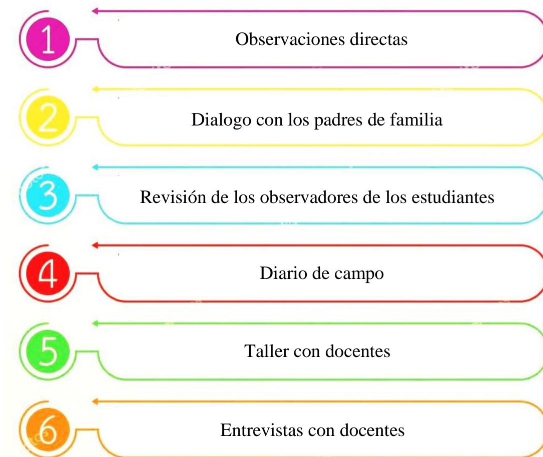
Figura 4. Esquema de diagnóstico