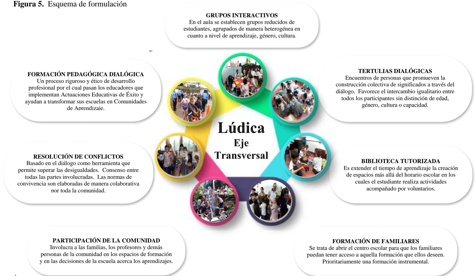
Figura 5. Esquema de formulación