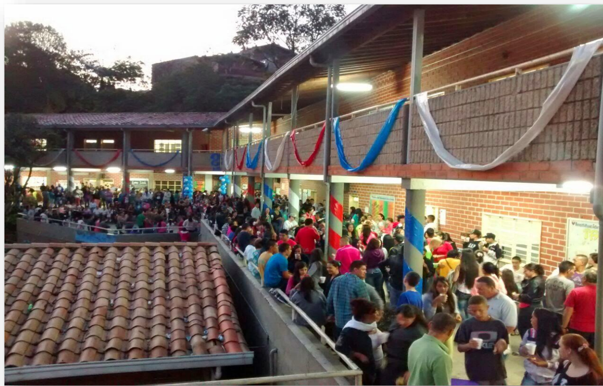
Fotografía 1. Planta física de la Institución Educativa Loma Linda