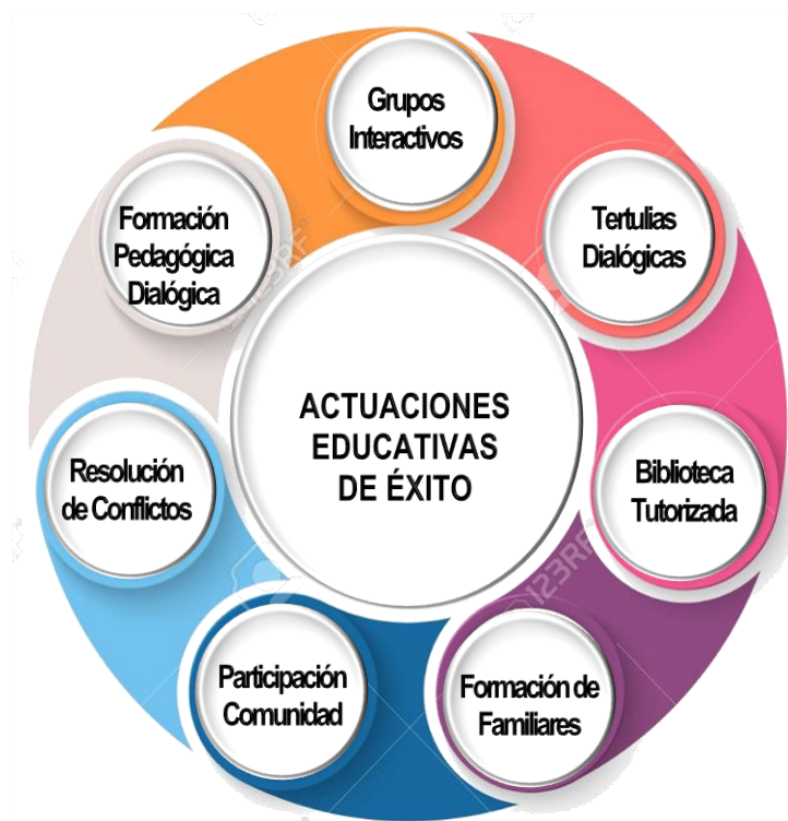
Figura 1. Actuaciones Educativas de Éxito