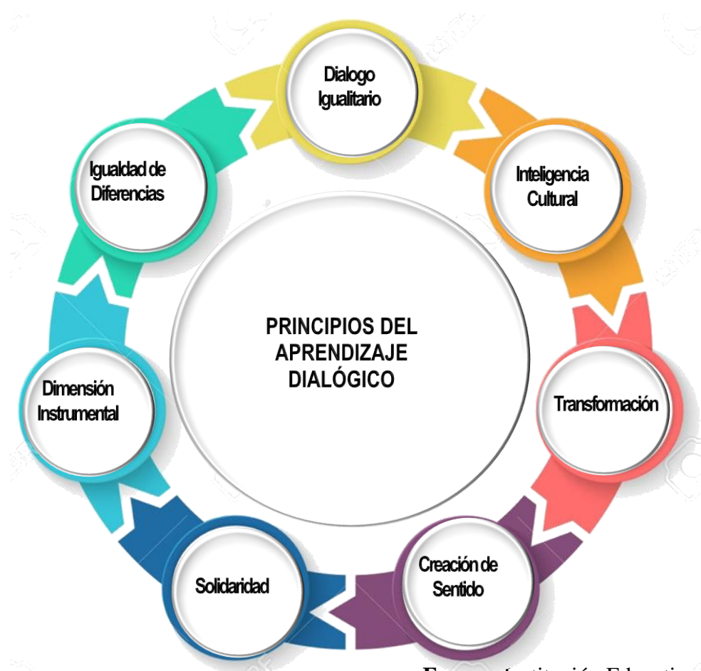
Figura 2. Principios del Aprendizaje Dialógico