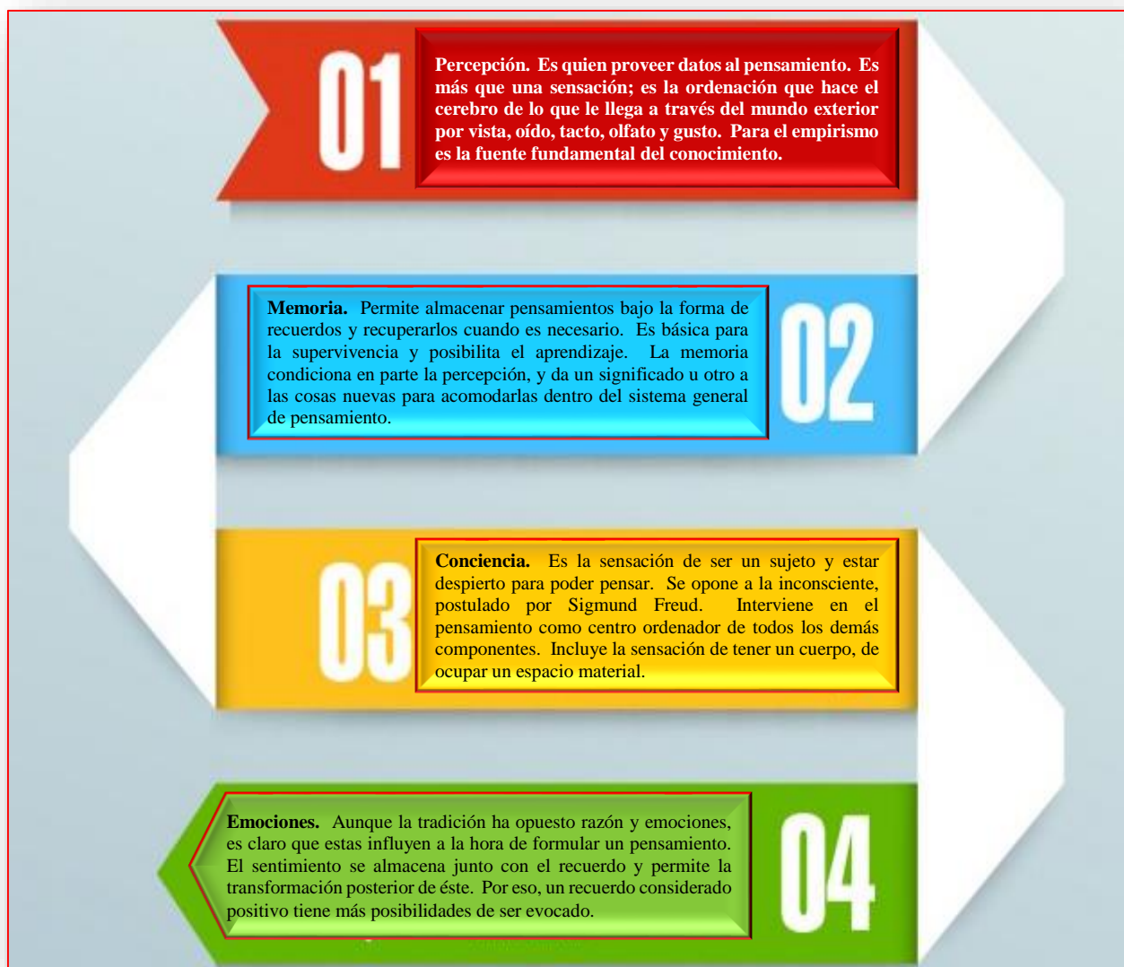
Figura 3. Los componentes del pensamiento