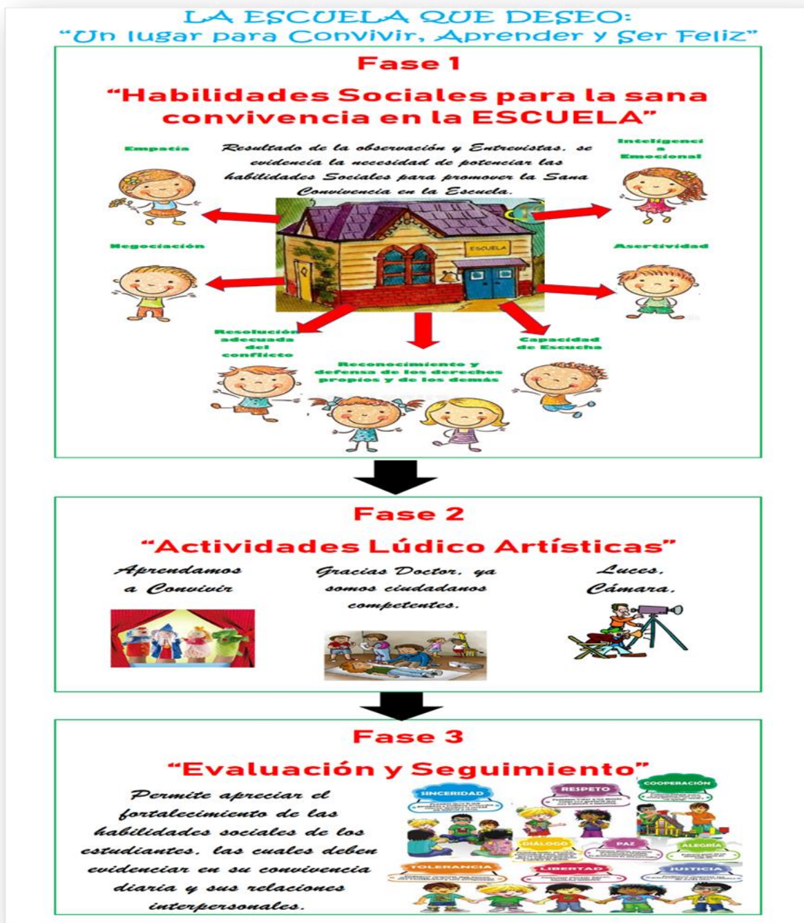
Figura 1. La Escuela que Deseo