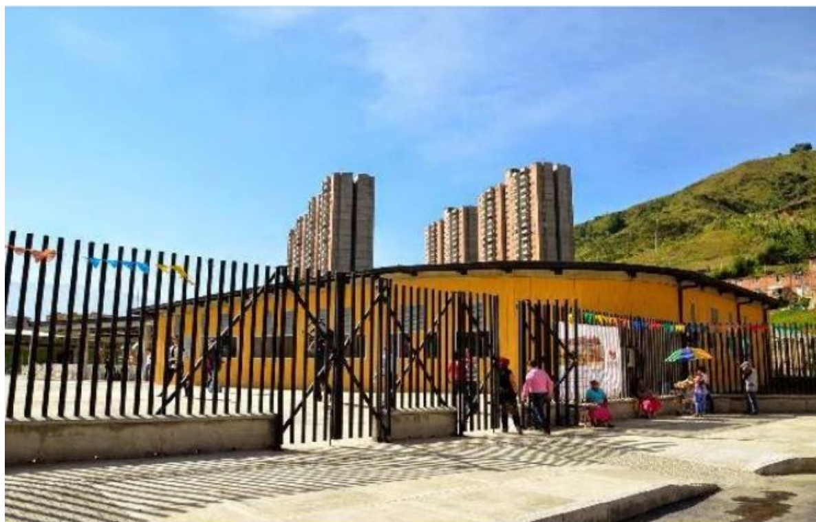
Imagen 2. Sede Nuevo Amanecer