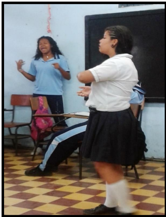
Dramatizado: Lo que no le gusta al amor. “la mentira y la traición”