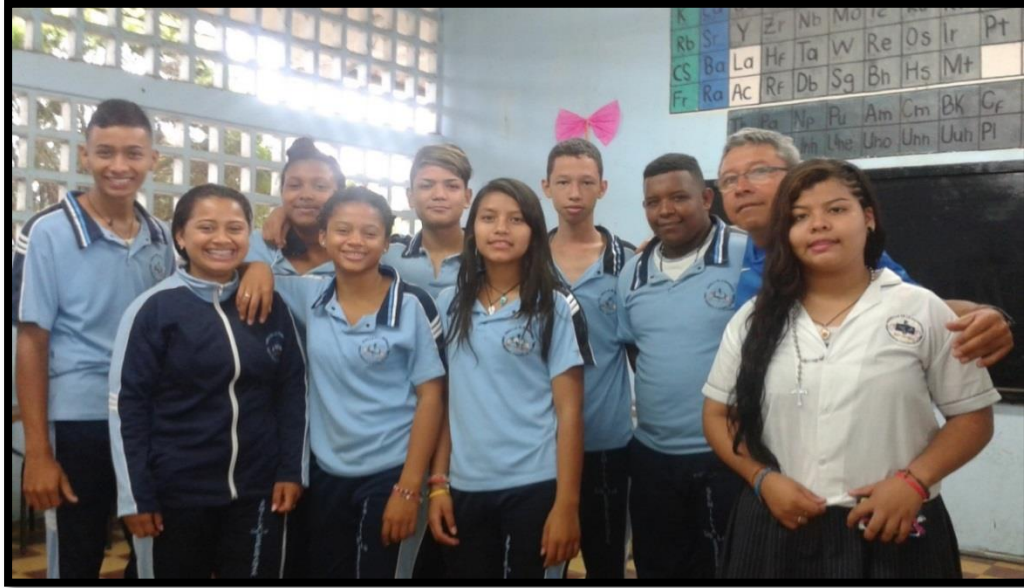
Estudiantes grupo 9.2. I.E Semilla de la Esperanza