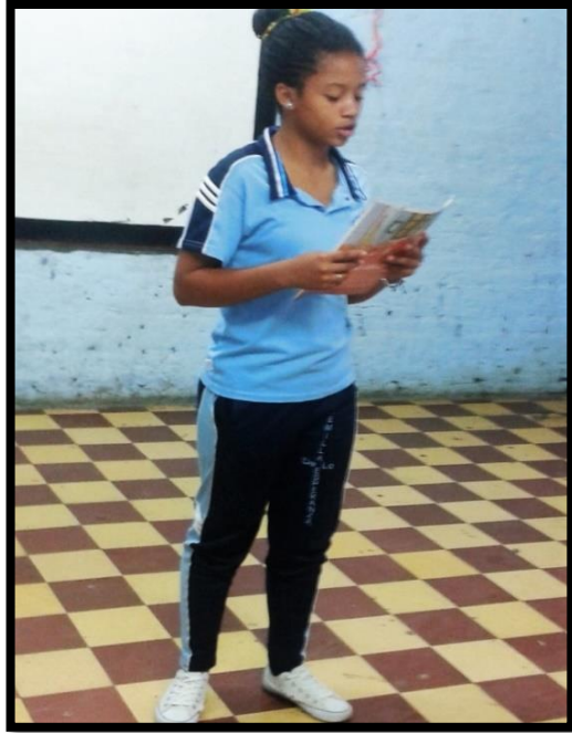
Lectura del cuento. Mi amigo el pintor