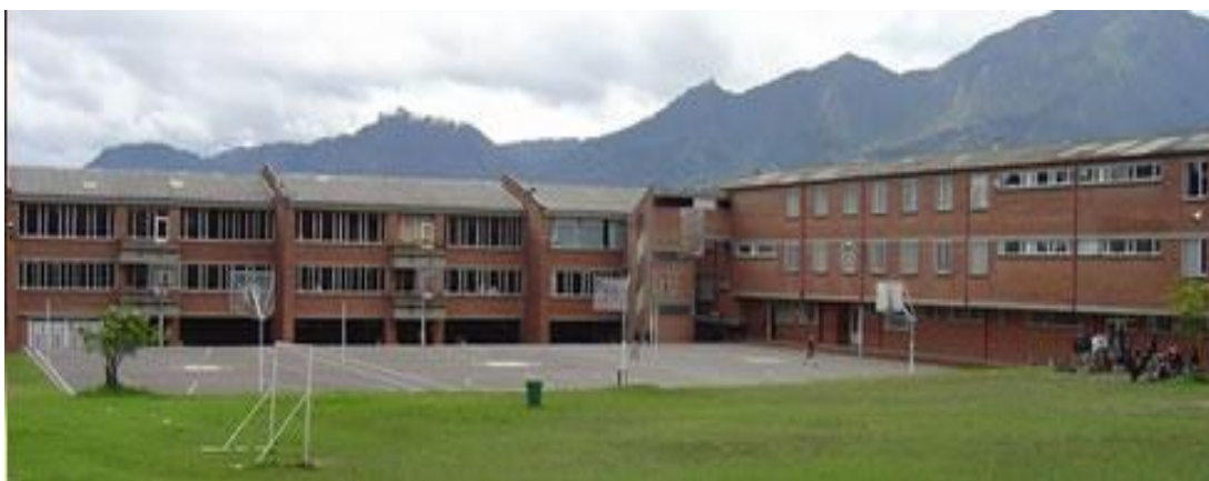
Imagen 1: Panorámica Colegio El Carmen Teresiano