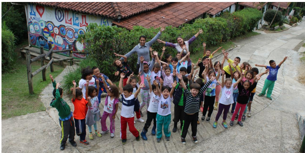
Imagen 1. Niños y docentes grado Transición y Primero Colegio Soleira