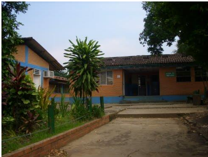
Imagen 1. Institución Educativa La Buitrera.