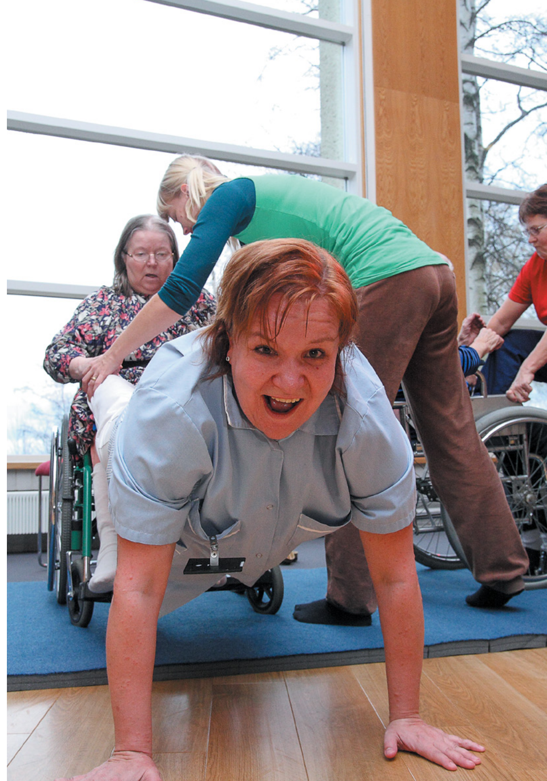
SUSANNA LYIV, LASTEN JA NUORTEN KULTTUURIKESKUS Pii Poo