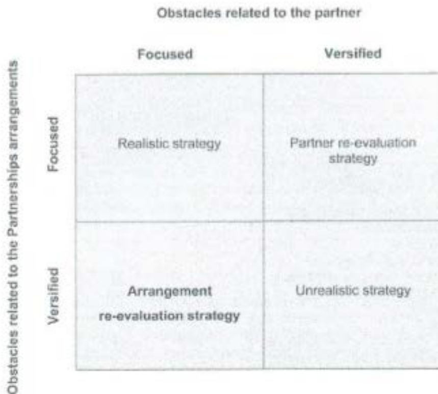
Kuvio 3. Kumppanin/kumppanuuksjärjestelyjen ongelmamatriisi (Ayoubi & Massoud 2011)

Edellä on jo todettu, että kansainvälisyys on korkeakouluissa alkanut lähinnä liikkuvuudella ja korkeakoulumaailmassa on harjoitettu opiskelija-, opettaja- ja tutkijavaihtoja jo useita vuosikymmeniä. Aiemmat tutkimukset ovat osoittaneet, että ongelmakohtiksi kansainvälisissä kumppanuuksissa nousee kumppaneiden välinen luottamus, yksipuolisuus tai epätasapaino kumppaneiden välillä, taloudelliset esteet, kulttuurilliset kysymykset, henkilökunnan sitouttaminen, resurssit, heikko viestintä, laadulliset esteet ja opiskelijoiden vaikutus. Britanniassa neljän korkeatasoisen korkeakoulun osalta toteutettu tutkimus osoitti, että suuremmat ongelmat kansainvälisiin kumppanuuksiin ovat varsinaiset kumppanuuksjärjestelyihin liittyviä asioita kuin itse kumppaniin liittyviä (kuvio 3). (Ayoubi & Massoud 2011).