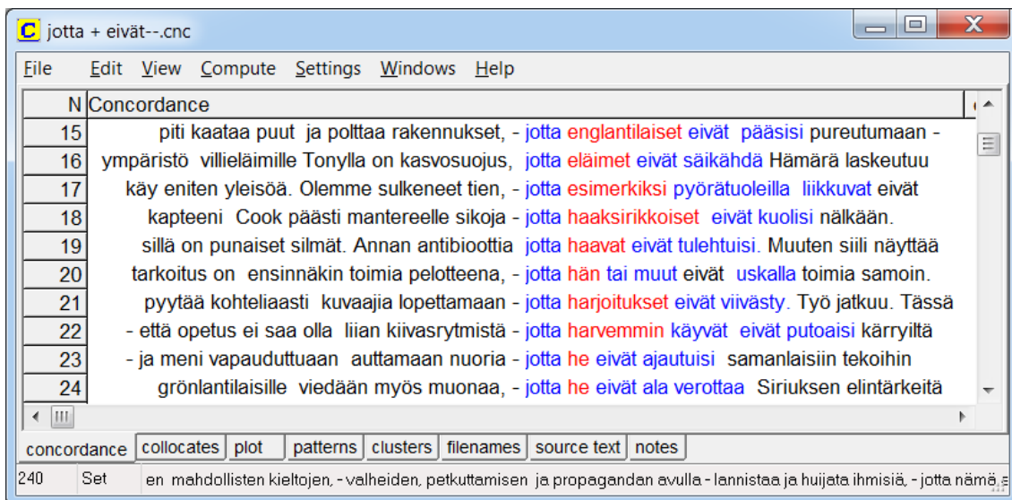
Kuva 2. KWIC-näkymän lajittelukeinona R1–R3

Toisessa konkordanssilistojen uudelleen järjestelyssä listat lajiteltiin käyttämällä ensisijaisena lajittelukeinona R1:tä (suoraan hakusanaa seuraava sana), toissijaisena R2 (toinen sana oikealle hakusanasta) ja kolmantena keinona R3 (kolmas sana oikealle hakusanasta). Tilanne nähtävissä kuvassa 3, kun hakusanana on jotta ja kontekstisanana eivät . Tämän lajittelun tarkoituksena oli muokata konkordanssinäkymää niin, että esiintymien aakkosellista listaa voitiin käyttää tutkimaan hakusanojen läheisimpiä sanoja, tässä tapauksessa siis hakusanan jäljessä tulevia sanoja, etenkin verbejä ja seuraako hakusanaa mahdollisesti persoonapronomini. Siis kaiken kaikkiaan etsittiin kollokaatteja, eli hakusanan lähimpiä sanoja.