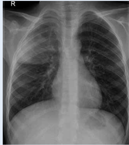
KUVA 1. Alveolaarinen pneumoninen varjostuma oikeassa ylälohkossa.

Jos kliinisesti ei epäillä keuhkokuumetta, lapselta ei ole syytä ottaa keuhkokuvaa mahdollisten keuhkokuumeeseen liittyvien radiologisten muutosten löytämiseksi. Brittiläisessä satunnaistetussa tutkimuksessa otettiin keuhkokuva kaikilta lapsilta, joilla esiintyi yskää ja hengityksen tihentymistä, ja varsinkin pienten lasten saamat mikrobilääkehoidot lisääntyivät mutta paraneminen ei muuttunut kuvaamatta jätettyihin verrattuna (6). Brittiläisissä keuhkokuumeen hoito-ohjeissa bakteeripneumoniaa pidetään käytännössä poissuljettuna, jos alle 2-vuotiaalla lapsella esiintyy uloshengityksen vinkunaa (2).