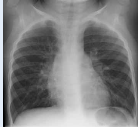
KUVA 3. Virusinfektion yhteydessä todetaan hiukan suurentuneet hilusimusolmukkeet ja perihilaarista juosteista kuviolisää.

12 tunnin aikana. Toisaalta keuhkokuumeen komplikaatiot, kuten empyeemat, ovat lisääntyneet useissa maissa viimeisten 25 vuoden aikana. Tästä syystä kaikki nykyiset hoito-ohjeet korostavat toipumisen varhaisen alkamisen tärkeyttä (2, 3). Jos toipuminen ei ole alkanut 48 tunnin aikana mikrobilääkkeen aloittamisesta, lapselle on tehtävä uusi huolellinen kliininen tutkimus sekä harkittava keuhkojen kuvausta, etiologiaa tutkimuksia ja mikrobilääkehoidon tehostamista ( TAULUKKO ).