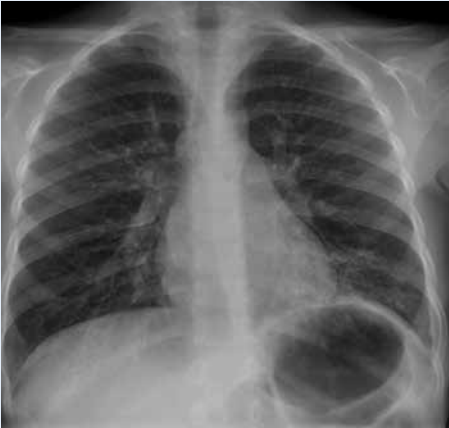
KUVA 2. Interstitiaalinen tulehdusmuutos vaemmalla alalohkossa.