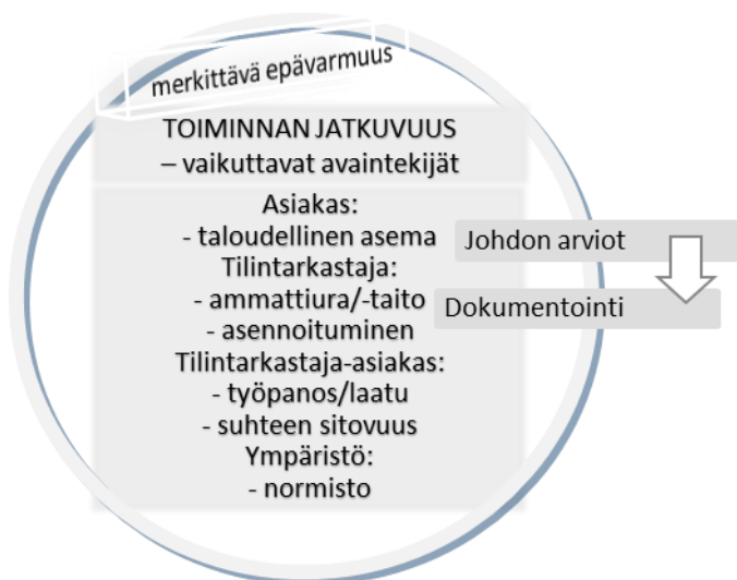
Kuvio 3. Toiminnan jatkuvuuden arvioinnin ja raportoinnin viitekehyksen keskiön täydennys.

Toiminnan jatkuvuuden periaatteen soveltumiseen vaikuttaa kuitenkin ehkä eniten tai ainakin näkyvästi käsitteen ”merkittävä epävarmuus” tulkinta ja soveltaminen. Tilintarkastajan ammatillisen harkinnan tulos merkittävän epävarmuuden tilasta toiminnan jatkuvuudessa näkyy asiakkaan tilintarkastuskertomuksessa ja näin ollen asiakkaan toiminnan heikkoudesta tai vaikeudesta tulee julkista. Merkittävän epävarmuuden käsitteen ymmärtäminen on tärkeää myös itse asiakkaalle, sen sidosryhmille, tilintarkastuskertomusten lukijoille ja tutkimukselle. Merkittävä epävarmuus onkin nostettu viitekehyksen keskiön kehälle (kts. kuvio 3), joka kuvaa tämän käsitteen oleellista vaikutusta toiminnan jatkuvuuden epävarmuustekijöiden ympäristössä. Alle on täydennetty vain toiminnan jatkuvuuden arvioinnin, analysoinnin ja raportoinnin viitekehyksestä sen keskiö, koska muulta osin viitekehys (kts. kuvio 2) pysyy muuttomattomana.