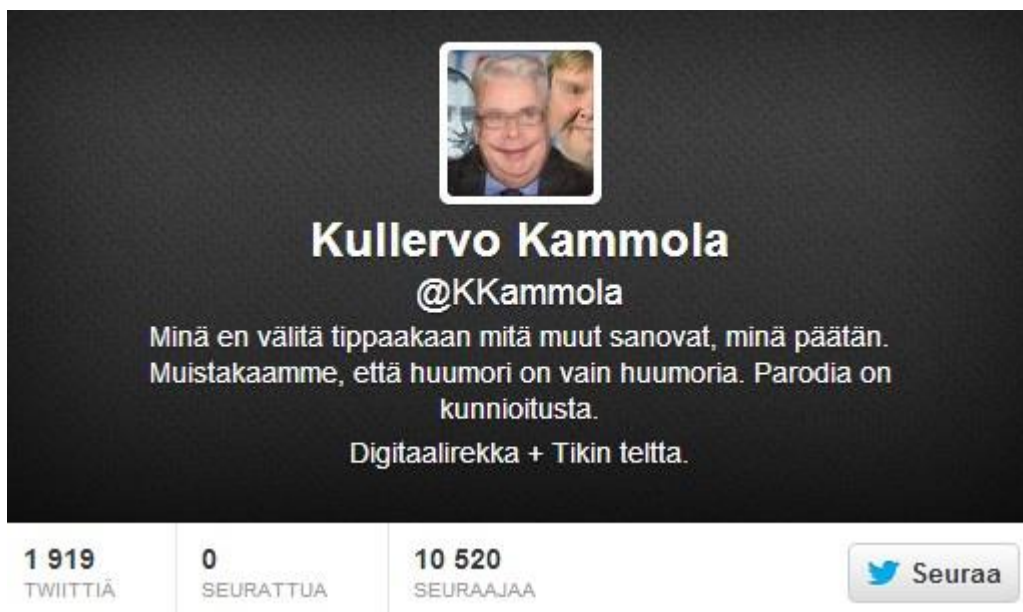
Kuva 1: Kullervo Kammola -parodian profiili Twitterissä 18.1.2014.

Kammolan profiilikuvaa on käsitelty hieman venyttämällä muun muassa Kalervo Kummolan suuta ja sumentamalla silmiä. Kuvaan taka-alalle on lisätty jääkiekon A-maajoukkueen johtajan Timo Jutilan kuva. Toisella puolella näyttäisi olevan Anders Chydenius, jonka kasvot koristivat vanhaa tuhannen markan seteliä. Profiilitekstissään – jonka mitta on rajoitettu 160 merkkiin – Kammola kertoo melko selkeästi tekevänsä huumoria ja sanoo “parodian olevan kunnioitusta”. Aivan kuten useissa pakinoissa, tässäkin ulkoiset tunnukset ovat siis selvästi näkyvillä: lukija tajuaa nopeasti lukevansa tekstiä, jota ei ole tarkoitettu tosissaan otettavaksi.