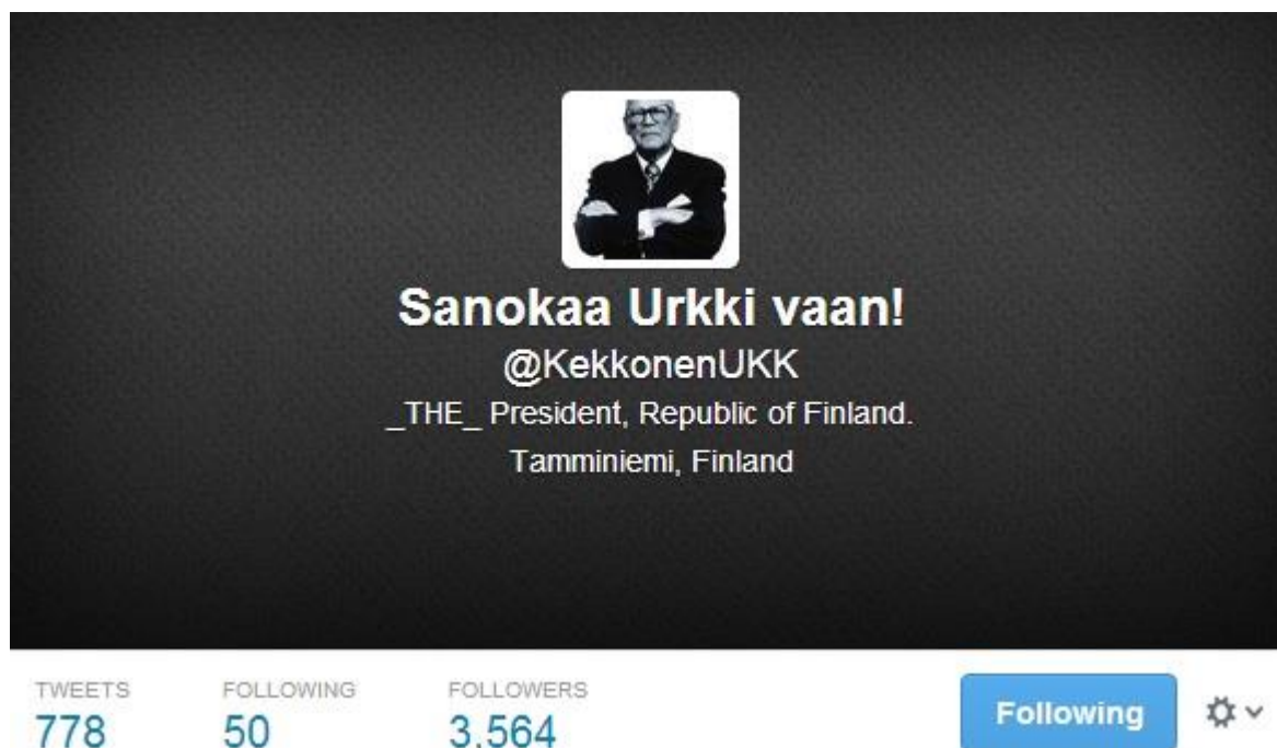
Kuva 5: Urho Kekkonen parodiatili Twitterissä 15.2.2014

Kekkosparodiassa ei mainita selvästi sanaa parodia, mikä on periaatteessa Twitterin sääntöjen vastaista. Nimen kohdalla kehoitetaan sanomaan vain "Urkki", mikä on tietenkin yksi Kekkonen lempinimistä. Kuvauksessa korostetaan tikkukirjaimin ja alaviivoilla merkiten, että kyseessä on _THE_ president. Tällä korostetaan Kekkonen asemaa Suomen pitkäaikaisimpana ja monien mielestä vahvimpana presidenttinä. The-artikkelisanan voi ajatella tarkoittavan myös sitä, että parodiassa Kekkonen mielletään nimenomaan nykyiseksi, parhaillaan virassa olevaksi presidentiksi. Kuvauksessa kerrotaan Kekkonen olevan Tamminiemessä, joka oli siis presidentin virka-asunto ennen. Kekkonen jälkeen rakennettiin Mäntyniemi, jossa muut presidentit ovat edustaneet. (Mäntyniemen esittely, i.v.)