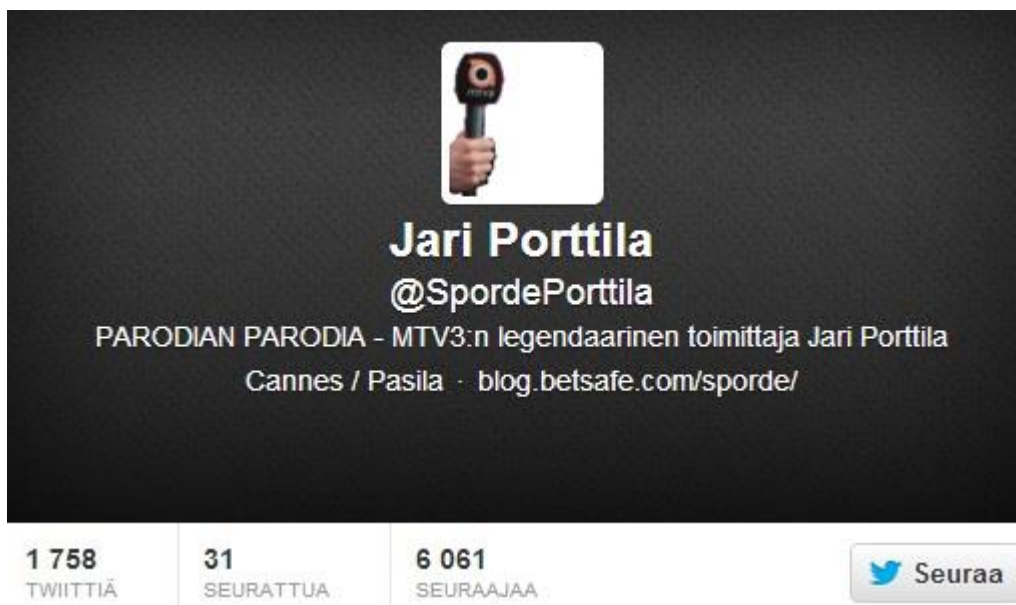
Kuva 2: Jari Porttila -parodian profiili Twitterissä 18.1.2014.