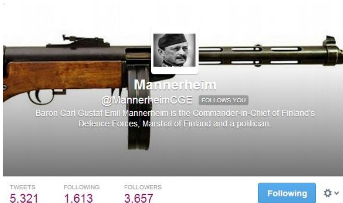
Kuva 6: Mannerheim-parodia Twitterissä 15.2.2014

Mannerheim-niminen tili on ottanut käyttäjänimekseen @MannerheimCGE. Twiittejä on kertynyt yhteensä peräti 5386, ja aineiston sata viimeisintä twiittiä ovat ajalta 23.1.2014–14.2.2014. Mannerheim-parodia twiittaa siis hyvin aktiivisesti.