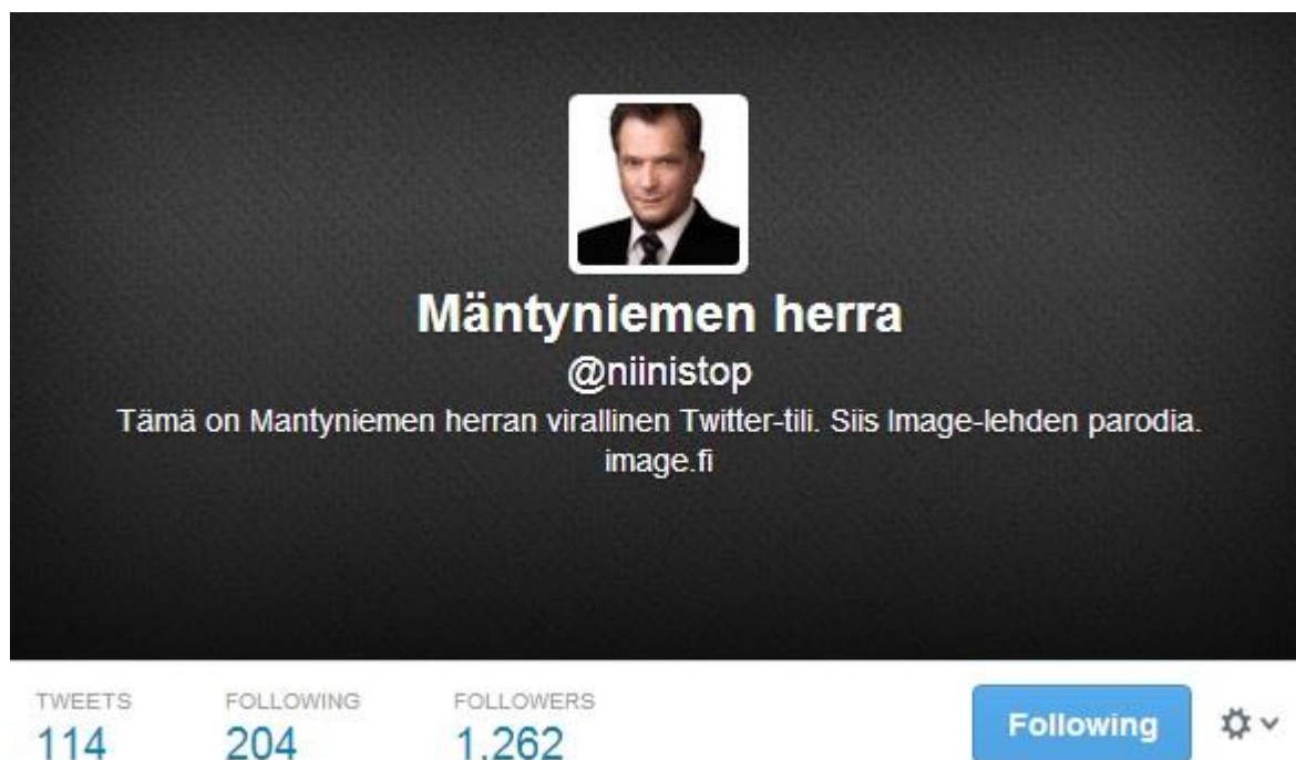
Kuva 4: Mäntyniemen herra -parodian profiili Twitterissä 15.2.2014