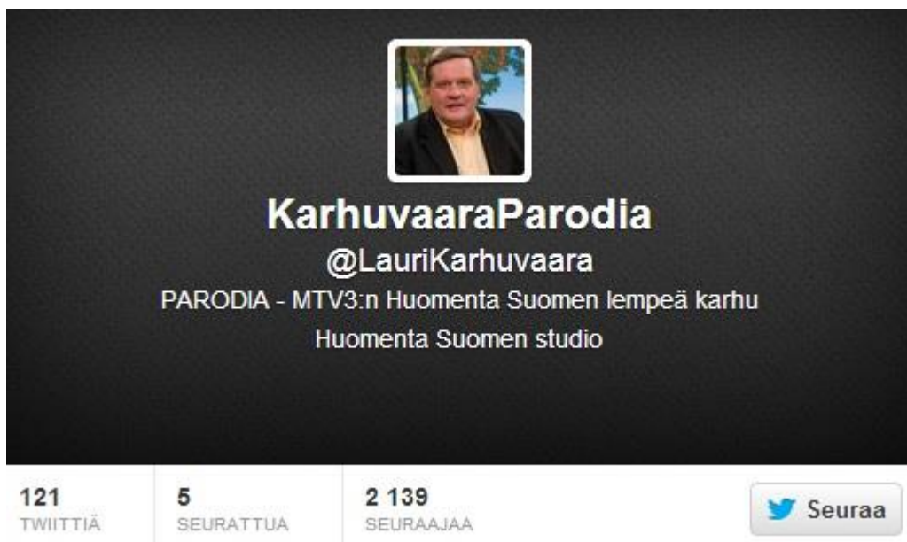
Kuva 3: KarhuvaaraParodian profiili Twitterissä 18.1.2014.

Parodian nimeksi on tullut Twitterissä KarhuvaaraParodia, vaikka käyttäjänimi onkin hieman hämäävästi @LauriKarhuvaara. Nimen lisäksi myös profiilikuvauksessa kerrotaan selvästi tämän olevan parodiaa, ja Karhuvaaraa kuvaillaan ”Huomenta Suomen lempeänä karhuna”. Karhuvaaran profiilikuvaa ei ole käsitelty. Googlen kuvahaulla selviää, että kyseinen kuva on napattu MTV:n nettisivuilta (Huomenta Suomen Lauri... 1.11.2009). Ulkoisesti kyseessä on selvä parodia. Edellä esitelty Sporde Porttila puhuu tosiaan usein juuri Karhuvaarasta, mutta en voi tietää, onko tilien taustalla sama tekijä tai tekijöitä.