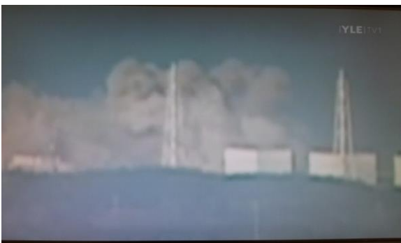
Kuva 1. Fukushima ensimmäinen vetryräjähdys 12.3.2011, juttu 24, otos 2.

Juttuja, joiden pääteemana oli Fukushima ydinvoimalaonnettomuus, oli aineistossa yhteensä 27 kappaletta, ja erityisesti aikarajauksen loppupäästä, 19.3.2011 eteenpäin, se oli yhtä poikkeusta lukuun ottamatta uutislähetysten Japania käsittelevien juttujen ainoa teema (liite 4). Myös suurin osa studiossa tai muussa tilassa tehdyistä pitkistä asiantuntijahaastatteluista käsitteli 12.3. eteenpäin Fukushima ydinvoimalaonnettomuutta. Onnettomuutta kuvitettiin heti ensimmäisestä vetryräjähdyksestä maaliskuun 12. päivän iltapäivällä seurantajakson viimeiseen päivään saakka hyvin samankaltaisilla kuvilla. Kuvamateriaalia dominoivat voimalasta kaukaa otettu, rakeinen ja epätarkka kuva, sekä hieman myöhemmin erilaiset ilmakuvat voimala-alueesta.