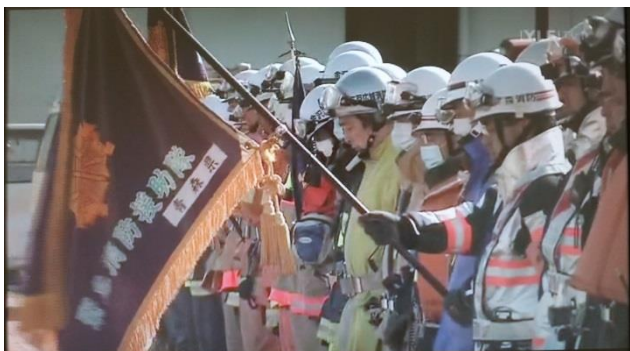
Kuva 6. Pelastustyöt taukoavat. Juttu 57, otos 30. 18.3.2011.