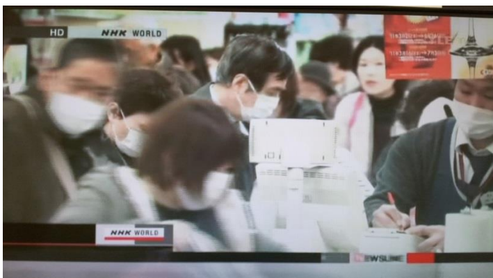
Kuva 8. Talouden rattaat pyörimässä. Juttu 38, otos 8. 14.3.2011.

Otoksissa 7-8 ihmiset jonottavat kaupan kassoille, ja toimittajan voice over kertoo, että Japanin keskuspankki on pumpannut markkinoille 140 miljardia euroa, mutta katastrofin vaikutukset ovat heijastuneet sekä muualle Aasiaan että Eurooppaan (juttu 38, liite 3). Otoksissa 9-11 puolestaan ollaan huoltoasemalla, jonne autot jonottavat tankattavaksi (emt.). Ääniraidalla Nokian edustaja kertoo puhelinhaastattelussa yhtiön tilanteesta (emt.). Otoksissa 12–16 seurataan ruuhka-aikaa tukiolaisella juna-asemalla, ihmisiä kävelee portaissa ja ahtautuu juniin asemahenkilökunnan avustuksella (emt.). Voice overissa selitetään katastrofin infrastruktuurille aiheuttamia vahinkoja ja niiden vaikutuksia muun muassa maailman elektroniikkateollisuuteen (emt.). Lopuksi palataan suomalaisen asiantuntijan pariin, joka kertoo, että elektroniikkateollisuudessa vahingot jakautuvat eri tavoin eri toimijoille (otos 17/19, juttu 38, liite 3). Tästä siirrytään toimittajan viimeiseen kommenttiin, jonka mukaan jälleenrakentaminen voi vauhdittaa myös Japanin talouden toipumista (otos 18/19, emt.). Jutun lopettaa haastateltava, joka muistuttaa, että jälleenrakennuksessa myös suomalaisyhtiöt voivat hyötyä esimerkiksi puutavaran kysynnän kasvusta (otos 19/19, emt.).