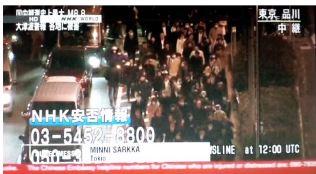
Kuva 9. Liikennekaaosta Tokiossa maanjäristyspäivän iltana, 11.3.2011. Juttu 20, otos 12.

täyttyivät jalan tai takseilla kotiin pyrkivistä ihmisistä (juttu 20, liite 3). Kuvassa pimenevässä illassa suuri joukko ihmisiä kävelee jalkakäytävällä ja tien autokaistat ovat molempiin suuntiin täynnä (emt.). Otoksissa 12–15 teknillisen yliopiston työntekijän haastattelu jatkuu, ja hän kuvailee kuinka suuren kaupungin infrastruktuuri on kaaoksessa ja kännykät eivät toimi (emt.). Otoksessa 12 näkyy katu täynnä käveleviä ihmisiä, seuraavassa puolestaan tie täynnä autoja, otoksessa 14 kamera pysähtyy hetkeksi taksitolppaan ja sen takana kiemurtelevaan jonoon (emt.). Otoksessa 15 ihmiset jonottavat juna-asemalla, ja kamera tarkentaa pää polvissa nuokkuvaan mieheen (emt.). Otoksessa 16 toimittaja toteaa, ettei paikallisten viranomaisten ohjeista ole apua suomalaisille, kuvassa poliisi puhuu megafoniin (emt.). Seuraavien kolmen otoksen aikana haastateltava kertoo, etteivät suomalaiset ymmärrä ohjeista mitään, vaikka niitä jatkuvasti näkyikin (otos 17/28–20/28, juttu 20, liite 3). Haastateltavan mukaan tokiolaiset kerääntyvät elektroniikkakauppojen eteen katsomaan televisiota, koska tietoa ei muualta saa eikä kotiin pääse (emt.). Kuvissa kuvataan ylhäältäpäin linja-autoon kiemurtelevaa jonoa (otos 17), kadulla kulkevia poliiseja (otos 18) ja kaupan edessä kadulla jonottavia ihmisiä (otos 19).