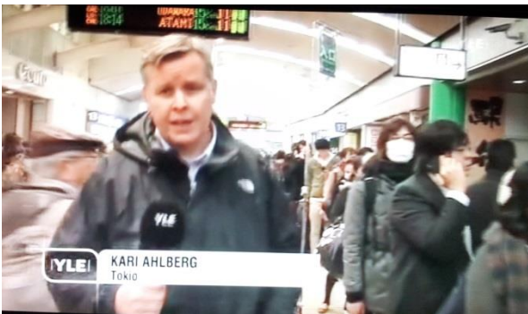
Kuva 11. Paniikkia ruuhkassa? Juttu 42, otos 8. 15.3.2011.

Kuten edellä käy ilmi, ei tarvinnut mikroskooppia havaitakseen, miten affektiivisuutta jutussa rakennetaan, toisin kuin esimerkiksi alaluvun 3.3. talousjutuissa. Juttu oli suorissa tunneilmauksissaan ja konkretiassaan jopa suorasukainen, ja kuten täsmensin, siinä käytetään kertojan diskurssia hyvin ilmaisuvoimaisesti. Missä jutun 27 affektiivisuus rakentui kuvan affektiivisuuden takertumisesta tekstiin, siinä tässä jutussa kertojan diskurssi sekä haastateltavien toimijoiden diskurssit merkityksellistävät kuvamateriaalia vahvemmin kuin kuva merkityksellistää tekstiä. Kenties monikerroksisin esimerkki jutun kerronnallisesta merkityksellistämistyöstä on otosten 5-7 voice over, joka rinnastaa ensinnäkin maanjäristyksen jälkeisen Tokion tilanteen toisen maailmansodan aikaiseen Tokioon ja toisekseen kytkee Fukushima ydinvoimalaonnettomuuden Hiroshimaan ja Nagasakiin pudotettuihin ydinpommeihin, toisin sanoen totaaliseen tuhoon ja ihmiskunnan kollektiiviseen traumaan (juttu 42, liite 3; vrt. alaluku 6.1.). Alaluvussa 6.1. hahmottelemani Fukushima ’säteilymörkö’ on läsnä tässäkin jutussa säteilyn pelon affektiivisena tahmaisuuksena, joka tarrautuu kaikkeen jutussa kuvattuun toimintaan. Vaikka Fukushima tilanteeseen viitataan vain epäsuorasti otoksissa 12–16, Fukushima vaurioitunut ydinvoimala ja siitä vuotava säteily ovat jutussa nimetyn pelon lähde ja säteilyn pelko puolestaan toiminnan liikkeelle paneva voima.