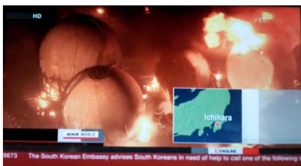
Kuva 7. Globalisaation käänntöpuoli? Juttu 23, otos 19. 11.3.2011

”Jos Japani joutuu kasvattamaan energiantuontiaan, voivat sen vaikutukset levitä laajalle. Japanin tapahtumat ovat jälleen muistutus yhteen verkottuneen maailman käänntöpuolesta.”