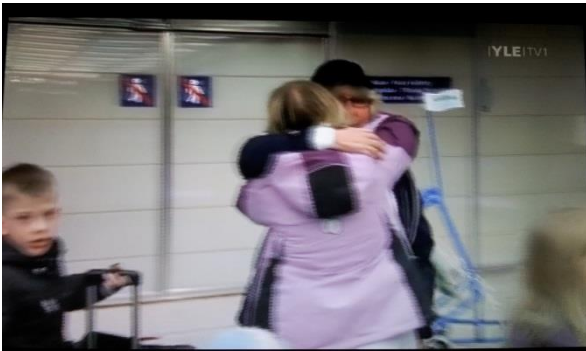
Kuva 10. Helpotuksen halaus lentoasemalla. Juttu 33, otos 5. 13.3.2011.

kolmena perättäisenä päivänä (13.–15.3.) Helsinki-Vantaan lentoasemalla kuvaamassa ja haastattelemassa Japanista saapuneita suomalaisia. Kaikki kolme juttua (33, 37 ja 44, liite 3) muistuttivat sekä rakenteeltaan että sisällöltään toisiaan: kahdessa jutussa oli haastateltu sekä mies- että naismatkustaja, ja haastateltavien vastaukset olivat keskenään samantapaisia ja osin myös sukupuolittuneita. Kaikissa kolmessa jutussa uutistenlukija nosti juonnossaan esille jonkin asian haastateltujen ihmisten näkökulmasta, ja he saivat kertoa tarinansa toimittajan keskeyttämättä tai kyseenalaistamatta. Palaajien haastatteluissa oli myös aineiston kaikista jutuista eniten suoria tunneilmaisuja, joko sanallisia tai sanattomia. Naishaastateltavat itkivät tai olivat purskahtamaisillaan itkuun (juttu 33, otos 6; juttu 44, otos 9; liite 3), kuvissa näytettiin toisiaan syleileviä ihmisiä, ja sekä toimittajat että haastateltavat puhuivat muun muassa järkytyksestä, pelosta ja epätietoisuudesta, mutta myös helpotuksesta (juttu 33, otos 6; juttu 37, otos 2, 5 ja 9; juttu 44, otos 6 ja 9).