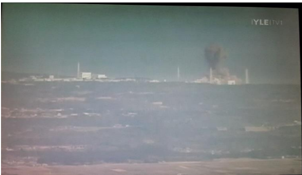
Kuva 4. Fukushiman toinen vetyräjähdys 14.3.2011, juttu 35, otos 11.