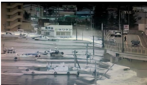
Kuva 5. "Hyökyaalto vei mukanaan lukemattomia taloja ja autoja..." Juttu 6, otos 5, 11.3.2011.

Ilmeisesti käsivaralta kuvatussa videokuvassa huone huojuu vimmatusti, kuva heiluu, ja ääniraidalta kuuluu toimittajan vaiettua huonekalujen ja rakennuksen heilumisesta aiheutuvaa ääntä sekä japaninkielisiä huudahduksia (juttu 6, otos 2/13, liite 3). Kuvan yläreunassa heilahtelevassa kyltissä näkyy Japanin yleisradion NHK:n logo (emt.). Toimittajan hiljaisuus kestää seuraavan otoksen alkuun saakka, noin viitisen sekuntia. Tästä havahduttavasta alusta juttu jatkuu järistysaluetta esittävän kartan (otos 3/13, juttu 6, liite 3) kautta toinen toistaan vaikuttavampiin katastrofimaaisemiin sillan ali ajelehtivista henkilöautoista ja laivoista (otos 5/13, juttu 6, liite 3) peltoa pitkin etenevään, kaiken tieltään hajottavaan mustan veden hyökyaaltoon (otos 7/13, juttu 6, liite 3) sekä veden vallassa olevasta palavasta kaupungista (otos 9/13 ja 11/13, juttu 6, liite 3) palavasta voimalaitoksesta nouseviin, useiden metrien korkuisiin tulipaloihin (otos 12/13, juttu 6, liite 3). Myös jutun ääniraita on vaikuttava: esimerkiksi otoksessa viisi toimittaja pitää jälleen tauon spiikkinsä päätteeksi, ja pauhaavan veden äänen lisäksi kuuluu vääntyvän metallin kirskunaa ja kolahtelua, kun vedessä ajelehtivat laivat ja autot törmäävät toisiinsa. Jutun lopuksi palataan vielä Tokioon, joka kuvitetaan särkyneellä bussipysäkillä ja toisiaan halaavilla naisilla (otos 13/13, juttu 6, liite 3).