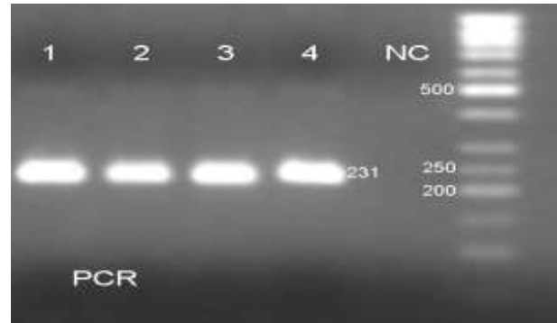
شکل ۱. نتیجه الکتروفورز محصول PCR با اندازه ۲۳۱ bp (چاهک ۱ تا ۴). چاهک ۵ نمونه کنترل منفی و چاهک ۶ مربوط به Ladder 50bp (Fermentas) می باشد.

ژن کد کننده سایتوکین ها یکی از کاندیدها در میان عوامل ژنتیکی میزبان به حساب می آید که پلی مورفیسم در پروموتور ژن می تواند منجر به تولید سطوح مختلف سایتوکین ها و پاسخ ایمنی منحصر به فرد شود (۲۳). پلی مورفیسم های موجود در ژن اینترلوکین ۱۸ با تعدادی از بیماری ها در ارتباط بوده است. در مطالعه Migita و همکاران بررسی ارتباط بین پلی مورفیسم پروموتور اینترلوکین ۱۸ در موقعیت ۶۰۷ و ۱۳۷ و پیشرفت بیماری های کبدی در بیماران مبتلا به هیپاتیت B مزمن، دیده شد که ژنوتایپ AA در موقعیت ۶۰۷ و آلل C در موقعیت ۱۳۷ در افراد سالم به طور چشمگیری بیشتر از افراد مبتلا به هیپاتیت B مزمن با پیشروی بیماری های کبدی بود (۲۴). در مطالعه Ramazi و همکاران بررسی ارتباط بین پلی مورفیسم A/C-۶۰۷ ژن اینترلوکین ۱۸ با میزان ایمونوگلوبین E سرم به عنوان یک عامل خطر برای بیماری رینیت آلرژیک، دیده شد که ژنوتایپ AC با افزایش سطح ایمونوگلوبین E موجود در سرم مرتبط می باشد که این می تواند موید تاثیر این پلی مورفیسم در بروز این بیماری باشد (۲۵). در مطالعه Nikiteas و همکاران در کشور یونان در بررسی ارتباط بین هتروزیگوسیتی پلی مورفیسم