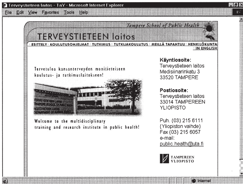
Kuva 1. Terveystieteen laitoksen verkkosivuston nykyinen etusivu.

muun koulutuksen yhteyteen. Myös linkkien nimet vaativat pohdintaa. Ehdotuksemme on, että etusivulle jäisivät vain esittely- , koulutus- , tutkimus- , ajankohtaista- , henkilökunta- ja in English -linkit.