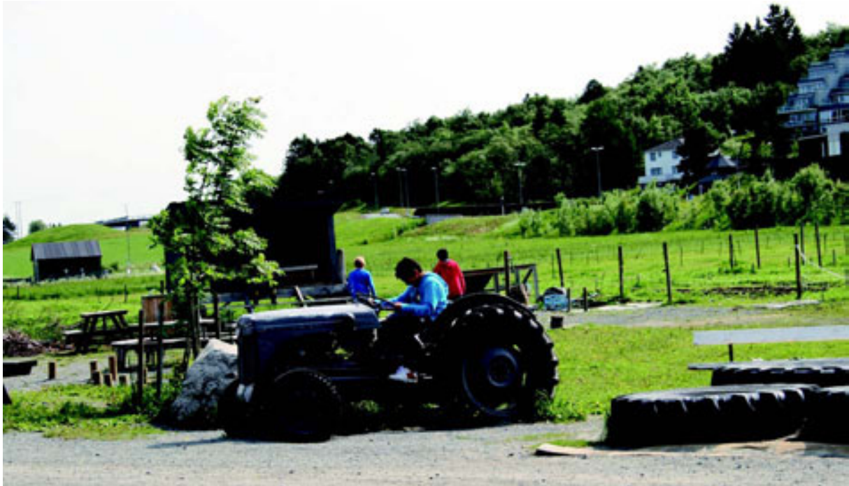
Fra sommeraktiviteter på Voll gård.