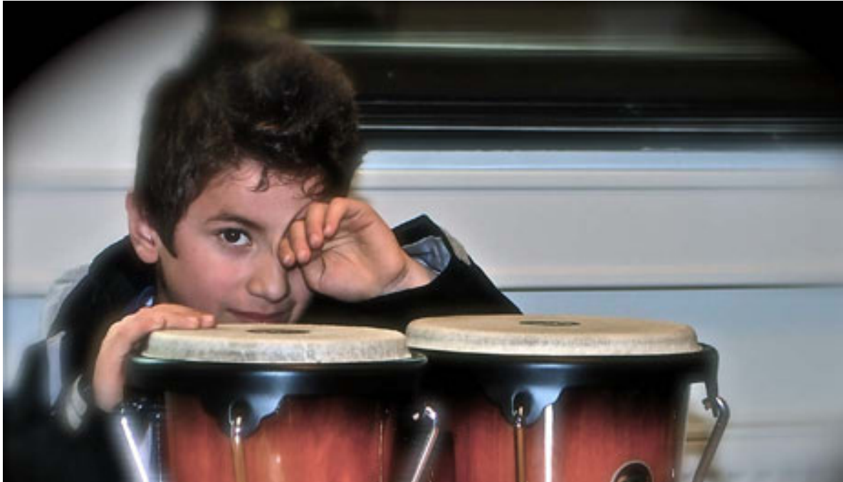
Fra Barnetimen på Saupstad bibliotek.