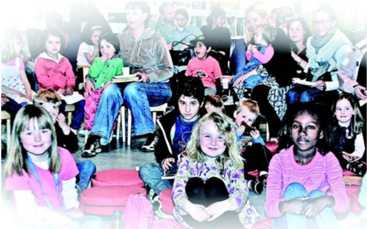
Fra Barnetimen på Saupstad bibliotek.