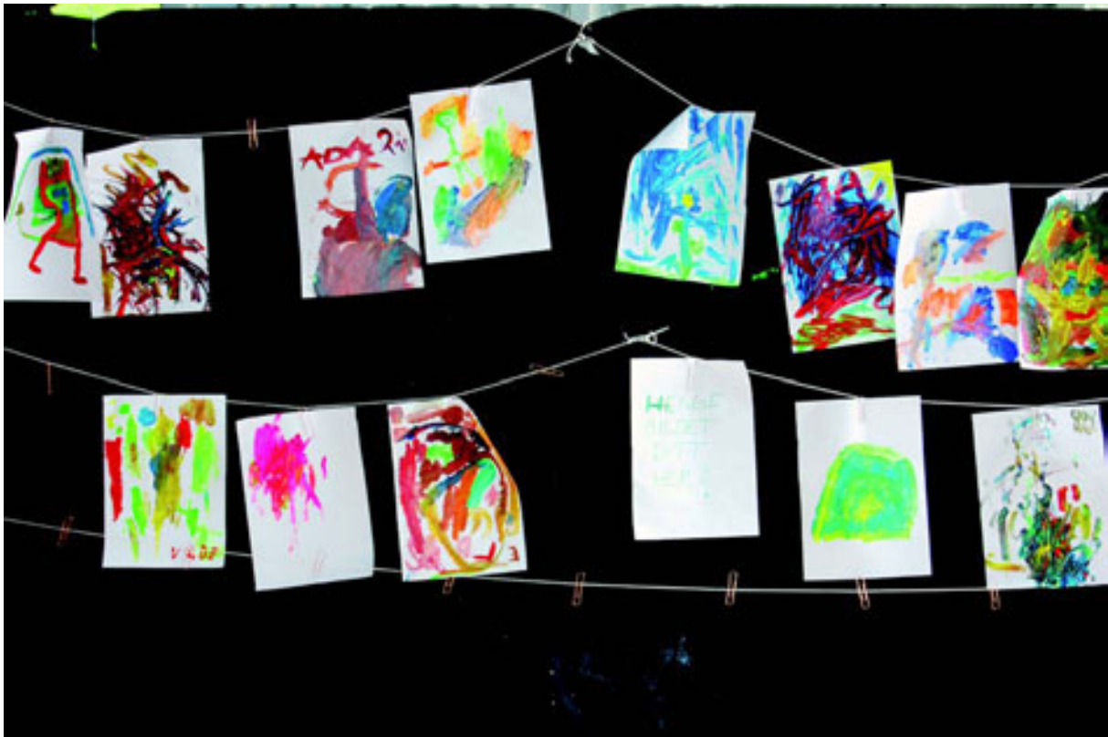
Fra Barnetimen under Pstereo-piknik.