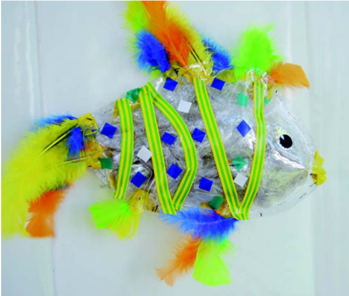
Fra Barnetimen under Oi! Trøndersk matfestival.