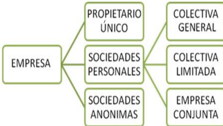
Figura 1 Clasificación de las empresas.