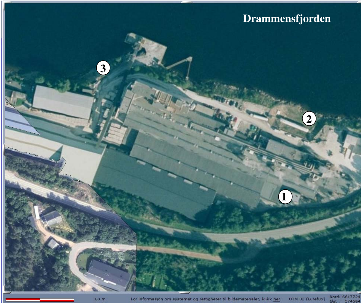
Figur 2. Norgips Norge AS sett fra luften. Prøvetakingspunkter er merket 1 – 3. Punktene 2 og 3 markerer utslippene til Drammensfjorden.